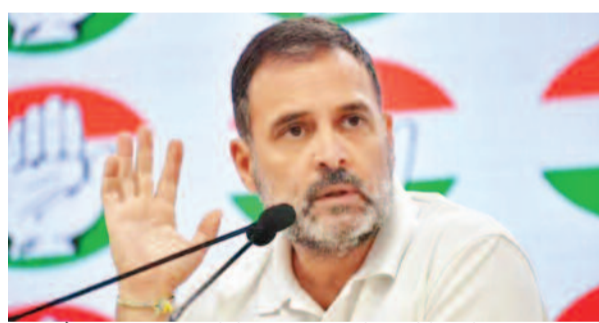
मॉडल है अंबानी-अडानी को देश का धन दिलाता और आरएसएस को सभी संस्थाओं को पकड़ना। उन्होंने कहा कि आरएसएस-बीजेपी को हम पीछे

भविष्य और शिक्षा व्यवस्था को खत्म करने में लगा है। उस संगठन का नाम आरएसएस है। यदि शिक्षा व्यवस्था उनके हाथ में चली जाएगी, जो धीरे धीरे जा रही है, तो देश बर्बाद हो जाएगा और इस देश में किसी को रोजगार नहीं मिलेगा। छत्रों के प्रदर्शन में पहुंचे राहुल गांधी राहुल गांधी ने बीजेपी पर हमला बोलते हुए कहा कि देश का सबसे बड़ा मुद्दा बेरोजगारी है, लेकिन प्रधानमंत्री बेरोजगारी पर नहीं बोलते हैं। पीएम का