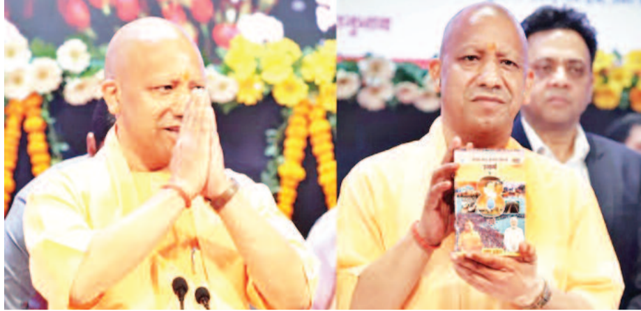
सरकारों में लोगों ने दोगे, आतंक को देखें। 8 वर्ष पहले उत्तर प्रदेश बीमारू राज्य माना जाता था, लेकिन आज वही प्रदेश अर्थ शक्ति के रूप में उभरा है। पहले यूपी को विकास का ब्रेक माना जाता था, पर आज वही यूपी विकास का उदाहरण बनकर उभरा है। उन्होंने कहा कि प्रदेश वही है, जनता वही है, सिस्टम वही है, सिर्फ सरकार बदलने मात्र से बड़ा बदलाव देखने को मिल रहा है। उत्तर प्रदेश में बीजेपी सरकार के

'उत्सव' मना रही है, जिसकी शुरुआत सोमवार से हो गई है। यह 'उत्सव' 14 अप्रैल तक मनाया जाएगा। इसके तहत पार्टी प्रदेश के जिलों में विभिन्न कार्यक्रमों के माध्यम से सरकार की तमाम उपलब्धियों के साथ जनसंवाद करेगी। प्रेस कॉन्फ्रेंस में सीएम योगी ने कहा कि हमारी डबल इंजन की सरकार में युवाओं, महिलाओं के लिए काम हुआ है। जनता ने 8 सालों में भरपूर समर्थन दिया है। बेटियां, व्यापारी पहले सुरक्षित नहीं थे लेकिन अब सुरक्षा की गारंटी है। सीएम ने आगे कहा कि पूर्व की