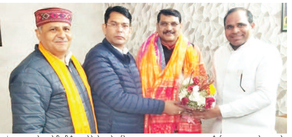
करंट क्राइम। कोर कमेटी की बैठक होने से पहले पर्यवेक्षक (राज्य सभा सदस्य) अमरपाल मौर्या का स्वागत करते भाजपा के प्रदेश मंत्री बसंत त्यागी, जिलाध्यक्ष सत्यपाल प्रधान एवं क्षेत्रीय उपाध्यक्ष मानसिंह गोस्वामी।

गाजियाबाद (करंट क्राइम)। नामित पार्षदों के लिए कोर कमेटी की बैठक बुधवार को गाजियाबाद भाजपा महानगर कार्यालय पर हुई। करंट क्राइम ने पहले ही बता दिया था कि कोर की बैठक होगी, इस दिन होगी और यहां होगी। कोर कमेटी का फार्मेट पहले ही आ गया था। कोर कमेटी की बैठक में नामों को लेकर जनप्रतिनिधियों ने अपना अपना पक्ष रखा। प्रत्येक नाम को लेकर पूरा मंथन हुआ। नामों के प्रोफाइल पर चिंतन हुआ और फिर नामित पार्षदों के लिए पर्यवेक्षक बनाये गये। पूर्व राज्यसभा सांसद तथा प्रदेश महामंत्री अमरपाल मौर्या अपने साथ 40 नामों की फाइल लेकर लखनऊ रवाना हो गये। कोर कमेटी की बैठक 3 बजे शुरू होनी थी और यह बैठक दोपहर 3 बजे भाजपा महानगर कार्यालय पर शुरू होती। उससे पहले टीक 3 बजे प्रदेश महामंत्री, राज्यसभा सांसद और पर्यवेक्षक अमरपाल मौर्या महानगर कार्यालय पहुंचे। कोर का फार्मेट सबको पता था और फिर अन्य सदस्य पहुंचे और इसके बाद कोर कमेटी की बैठक शुरू हुई।