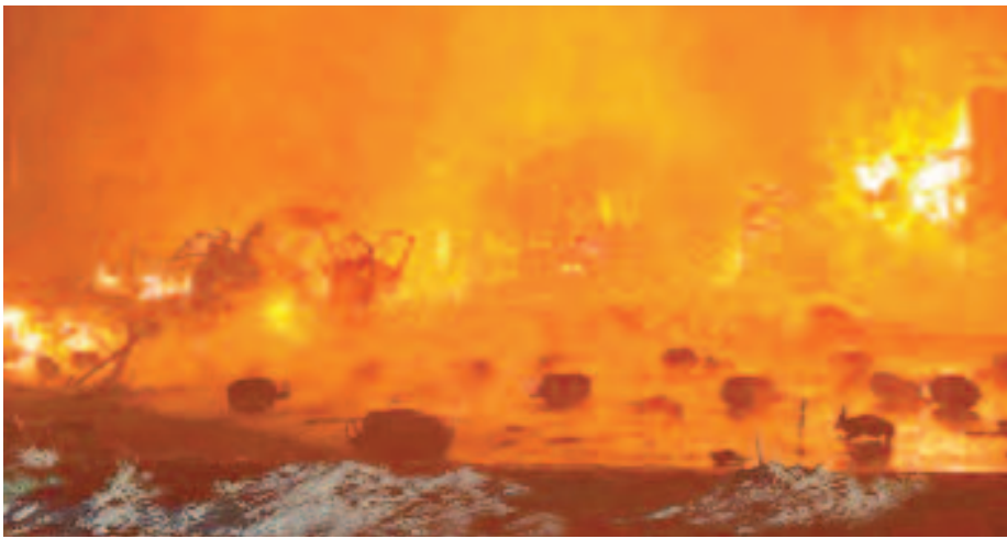
चक्कर लगाकर आग पर काबू पाया। शनिवार सुबह करीब 4:35 पर साहिबाबाद फायर स्टेशन को सूचना

गाजियाबाद, करंट क्राइम : शनिवार को साहिबाबाद इलाके के भौपुरा मार्ग पर उस समय लोगों की नौद टूट गई जब उन्होंने एक के बाद एक गैस से भरे गैस सिलेंडर के फटने की आवाज सुनाई दी। गैस सिलेंडर से भरे ट्रक में शॉर्ट सर्किट के बाद आग लगने और फिर देखते ही देखते आग ने अपना कोहराम मचा दिया था। गैस के सिलेंडर फटते तो इसकी गूंज कई किलोमीटर तक सुनाई दी। वहीं गैस सिलेंडर के लोहे के छोट-बड़े टुकड़े मकान की दूसरी मंजिल से लेकर आधे से ज्यादा इलाके के घरों और छतों पर पहुंच गए। इस हादसे में गनीमत यह रही कि किसी की जान नहीं गई है। हालांकि दमकल विभाग के अधिकारियों ने करीब डेढ़ घंटे की कड़ी मशक्कत और आठ गाड़ियों के द्वारा 100 से अधिक