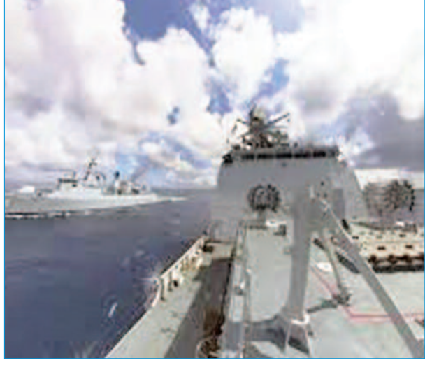
किया। हम स्थिति पर नजर रख रहे हैं और उसी के अनुसार प्रतिक्रिया देंगे। इससे पहले शनिवार को भी ताइवान के रक्षा

ताइपे। चीन की सेना द्वारा लगातार ताइवान की संप्रभुता का उल्लंघन किया जा रहा है। अब एक बार फिर ताइवान के रक्षा मंत्रालय ने दावा किया है कि रविवार को भी चीन के पांच विमानों और चीनी नौसेना के छह जहाजों ने ताइवान की सीमा का उल्लंघन किया। ताइवान के रक्षा मंत्रालय के अनुसार, चार चीनी विमान ताइवान जलडमरूमध्य को पार कर ताइवान के वायु क्षेत्र में प्रवेश कर गए। शनिवार को भी चीनी विमानों ने ताइवान की सीमा का उल्लंघन किया था ताइवान के रक्षा मंत्रालय ने सोशल मीडिया पर साझा एक पोस्ट में लिखा कि 'रविवार सुबह छह बजे ताइवान की सीमा के पास उड़ते पांच चीनी विमानों और छह जहाजों के बारे में पता चला। इनमें से चार विमानों ने मध्य रेखा को पार किया और ताइवान के उत्तरी और दक्षिण पश्चिम एडीआईजेड में प्रवेश