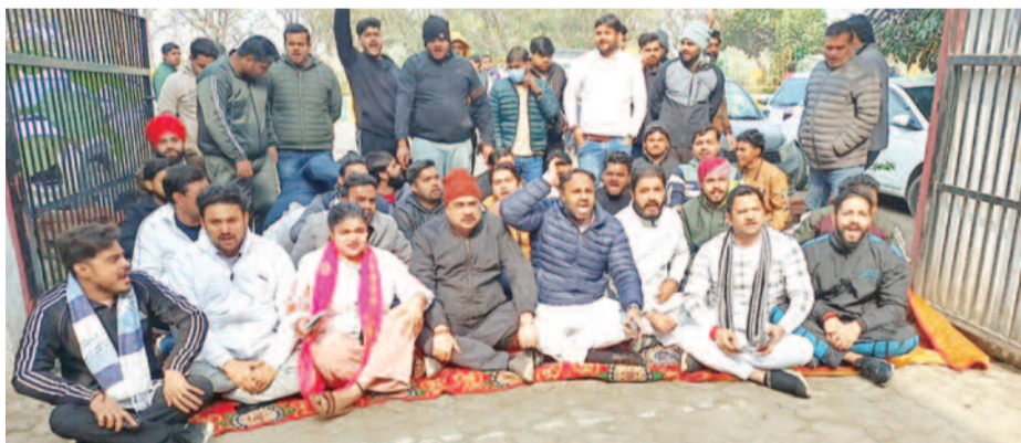
गाजियाबाद (करंट क्राइम)। सरकार नाराज भी भाजपा वाले ही हैं। विपक्ष भाजपाइयों में आक्रोश है। मामला भाजपा की है, राज भाजपा का है और सरकार वाले साहिबाबाद विधानसभा के इंदिरापुरम