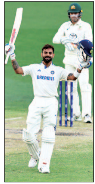
कोहली ने ऐसी पिच पर 46 रन बनाए थे जहां दक्षिण अफ्रीका की पूरी टीम 55 पर सिमट गई थी। कोहली के सामने जितनी ही बड़ी चुनौती आई वह उतनी ही रफ्तार के साथ उससे पार पाने में सफल रहे। हर टीम को ऐसे खिलाड़ी की जरूरत होती है। मौजूदा दौर पर कोहली सभी छह बार ऑफ स्टंप के बाहर की गेंद को छेड़ने के दौरान आउट हुए हैं।

पुर्व भारतीय क्रिकेटर संजय मांजरेकर ने ईएसपीएन क्रिकइंफो से कहा, एअब समय आ गया है जब उन्हें ना सिर्फ रन बनाने होंगे बल्कि इस समस्या से निकलने के लिए उन्हें आउट होने का कोई दूसरा तरीका भी ढूँढना होगा। मैंने अब तक ऐसा खिलाड़ी नहीं देखा है जिसका टेस्ट क्रिकेट पर कोहली जितना इम्पैक्ट हो और उसके साथ वह कमजोरी हो। मुझे नहीं लगता कि किसी शीर्ष क्रिकेटर के बल्लेबाज के साथ ऐसी कोई कमजोरी कड़ी रही हो। हाँ ऐसा हो चुका है कि कई बार खिलाड़ी एक ही तरह से आउट हुए हैं लेकिन कोहली के संदर्भ में यह काफी समय से घटित हो रहा है।