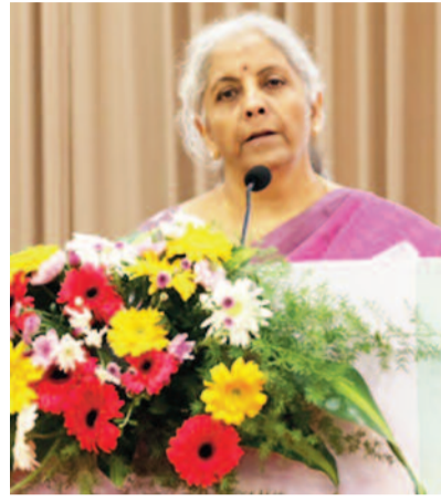
जिससे व्यवसायों को बेहतर वित्तीय योजना और प्रबंधन करने में मदद मिलती है। उन्होंने देश भर में एमएसएमई (पुराने औद्योगिक एरेंटे विकास कार्यक्रम का संशोधित संस्करण) के लिए इंटीग्रेटेड ऑडिट/बुककीपिंग से बचने में सक्षम बनाता है,

नई दिल्ली। एसोसिएटेड चैंबर ऑफ कॉमर्स एंड इंडस्ट्री ऑफ इंडिया (एसोचैम) ने सोमवार को कहा कि माइक्रो, स्मॉल और मीडियम एंटरप्राइजेज (एमएसएमई) को और सशक्त बनाने और व्यापार में आसानी के लिए इंटीग्रेटेड इन्फ्रास्ट्रक्चर टाउनशिप और यूनिवर्सिटी बनाने की जरूरत है।