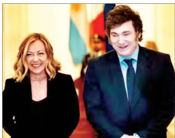
देश छोड़कर जाने वाले लोगों को जा रही है, वहीं देश में ही जन्मे विरासत के आधार पर नागरिकता दी जा रही है, वहीं देश में ही जन्मे अग्रवासियों के बच्चों को ही

रोम। इटली की सरकार ने अर्जेंटीना के राष्ट्रपति हावियर मिलेई को देश की नागरिकता देने का एलान किया है। इटली का यह फैसला मिलेई की इतालवी विरासत के चलते लिया गया है। हालांकि, अर्जेंटीना और इटली के विपक्षी दलों ने इस कदम का विरोध शुरू कर दिया है।