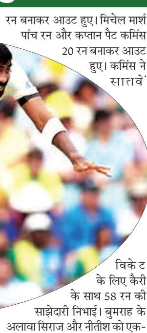
विकेट के लिए कैरी के साथ 58 रन की साझेदारी निभाई। बुमराह के अलावा सिराज और नीतीश को एक-

एक विकेट मिला। 385 के स्कोर पर ऑस्ट्रेलिया को पांचवां झटका लगा। सिराज ने कमिंस को विकेटकीपर पंत के हाथों कैच कराया। वह 20 रन बना सके। कमिंस ने एलेक्स कैरी के साथ सातवें विकेट के लिए 66 गेंद में 58 रन की साझेदारी निभाई। फिलहाल कैरी का साथ देने मिचेल स्टार्क आए हैं। ऑस्ट्रेलिया ने छह विकेट गंवाकर 370 से ज्यादा रन बना लिए हैं। फिलहाल एलेक्स कैरी और पैट कमिंस मैदान पर जमे हुए हैं। दोनों के बीच अर्धशतकीय साझेदारी हो चुकी है। कैरी आक्रामक बल्लेबाजी कर रहे हैं। 327 के स्कोर पर ऑस्ट्रेलिया को छटा झटका लगा। जसप्रीत बुमराह ने कहर बरपाते हुए ट्रेविस हेड को विकेटकीपर पंत के हाथों कैच कराया। वह 160 गेंद में 18 चौके की मदद से 152 रन बना सके।