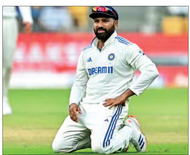
की साझेदारी हुई। यह भारत के खिलाफ टेस्ट में ऑस्ट्रेलिया के लिए चौथी सर्वश्रेष्ठ साझेदारी है। स्मिथ के आउट होने से पहले उन्होंने हेड के

ऑस्ट्रेलिया को 317 के स्कोर पर चौथा झटका लगा। स्मिथ हेड के साथ मिलकर ऑस्ट्रेलियाई पारी को 75 पर तीन से स्कोर 317 तक ले गए। दोनों के बीच चौथे विकेट के लिए 242 रन