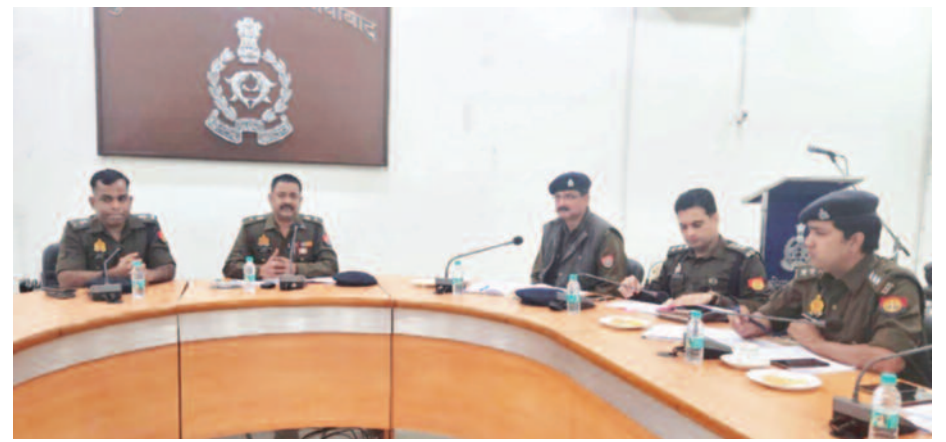
- पुलिस लाइन में हुई दो सर्किल के अधिकारियों की मीटिंग

गाजियाबाद, करंट क्राइम : 17 दिसंबर को गाजियाबाद नगर निगम के दो वार्डों में उपचुनाव है। जिसमें वार्ड 19 और 21 शामिल हैं। रविवार को दोनों ही वार्डों में होने वाले उपचुनाव को लेकर चुनाव प्रचार का अंतिम दिन था। शाम 5 बजे ही प्रचार बंद हो गया है। यहां 17 दिसंबर को मतदान होगा और 19 दिसंबर काउंटिंग की प्रक्रिया पूरी होने के बाद विजय प्रत्याशियों की घोषणा की जाएगी। नगर निगम उपचुनाव दो वार्डों में है, इसको लेकर पुलिस-प्रशासन अपनी तैयारी पूरी कर चुका है।