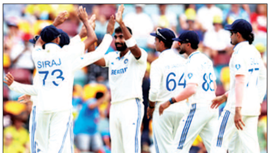
ये। यह बेवकूफी है। बेवकूफी भरी क्रिकेट। उनके पास लेगसाइड, डीप फाईट पर दो खिलाड़ी हैं और ट्रेविस

चैनल 7 के लिए कमेंट्री करते हुए उन्होंने कहा, मोहम्मद सिराज की यह अविश्वसनीय बात है, क्योंकि पिछले ओवर में उन्होंने एक खिलाड़ी को सही जगह पर रखा था और उन्होंने दौड़कर गेंदबाजी की, जो वे बिना किसी फील्डर के करने की योजना बना रहे