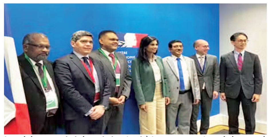
दिसानायके ने इस उच्च भागीदारी को एक विश्वासमत् रूप में स्वीकार किया। उन्होंने कहा कि इस विनियम में बाजार प्रतिभागियों की बड़ी

कोलंबो। श्रीलंका ने अपने अंतरराष्ट्रीय सॉवरेन बांड एक्सचेंज ऑफर के सफल समापन की घोषणा की है, जिसमें 98 प्रतिशत बांडधारकों ने भाग लिया। यह कदम देश को अपने ऋण का पुनर्गठन करने और नई बांड प्राप्त करने में मदद करेगा।