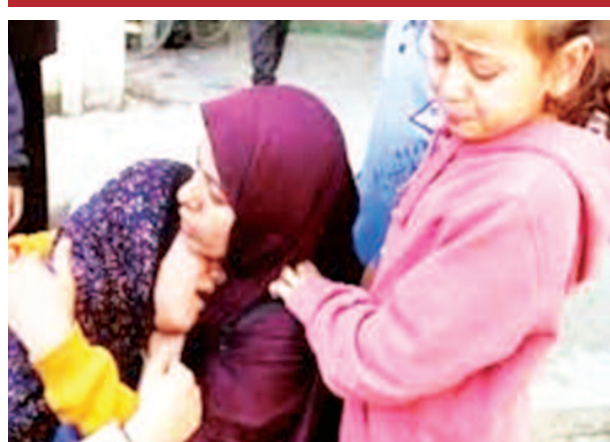
फलस्तीनियों के सामने भुखमरी संकट खड़ा हो गया है।

वहीं, दूसरी तरफ इस्राइली डिफेंस फोर्स (आईडीएफ) ने बताया कि मारे गए लोग शरणार्थियों की आड़ में छिपे हुए हथियारबंद लड़ाके थे। बता दें कि सात घोषणा अक्टूबर 2023 से जारी इस्राइली हमलों में अब तक लगभग 44 हजार फलस्तीनी मारे जा चुके हैं। इस बीच संयुक्त राष्ट्र राहत एजेंसी ने राहत सामग्री भेजनी भी बंद कर दी है, जिसके चलते गाजा में