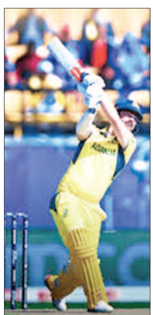
पर आउट कर महज 38 रनों के योग पर ऑस्ट्रेलिया को दूसरा झटका दिया। इसके बाद नीतीश रेड्डी ने मार्नस लायुशेन को भी 12 रनों के निजी स्कोर

इसके बाद बुमराह ने नाथन मैकस्वीनी को भी 9 रनों के निजी स्कोर