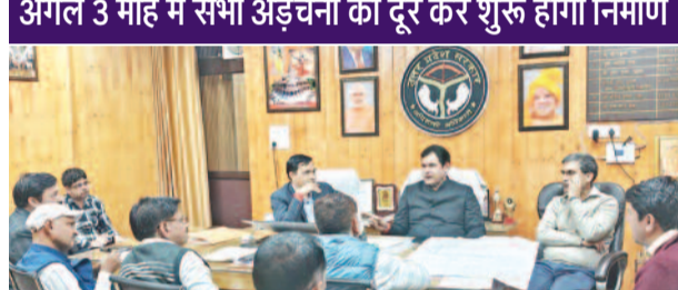
अगले 3 माह में सभी अड़चनों को दूर कर शुरु होगा निर्माण

लोनी, करंट क्राइम। लोनी विधानसभा की बड़ी समस्याओं में से एक बेहता बन्द फाटक की वर्षों पुरानी समस्या अब हल होने जा रही है।