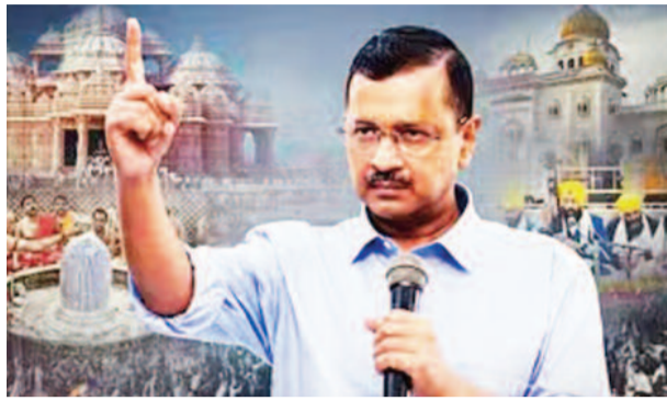
'अपने 20 राज्यों में पुजारी ग्रंथि सम्मान योजना लागू कर के दिखाओ'

नई दिल्ली। दिल्ली भाजपा ने मंगलवार को पूर्व मुख्यमंत्री केजरीवाल का एक पोस्टर जारी किया। पोस्टर में केजरीवाल को चुनावी हिंदू बताया गया है। पुजारी और ग्रंथी सम्मान योजना को लेकर भाजपा ने केजरीवाल पर हमला बोला है। इस पोस्टर पर पलटवार करते हुए आप ने भी आपन चैलेंज दिया है। दिल्ली विधानसभा चुनाव की घोषणा से पहले ही राजनीतिक दलों में घमासान मचा है। भाजपा और आम आदमी पार्टी एक-दूसरे पर वार-पलटवार करने का मौका नहीं छोड़ रही हैं। सोमवार को दिल्ली के पूर्व मुख्यमंत्री और आप संयोजक अरविंद केजरीवाल ने पुजारी और ग्रंथी सम्मान योजना की घोषणा की। इस पर मंगलवार को दिल्ली