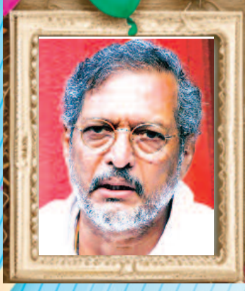
नाना पाटेकर अभिनेता