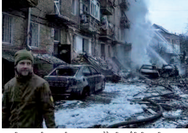
कजाखिस्तान की राजधानी अस्ताना में एक प्रेस कॉन्फ्रेंस में कहा, इरम कीव समेत सैन्य और निर्णय लेने वाले केंद्रों के खिलाफ हाइपरसोनिक मिसाइलों का इस्तेमाल करने से इंकार नहीं करते। रूस ने पिछले सप्ताह अपनी नई

कीव। रूस के राष्ट्रपति व्लादिमीर पुतिन ने गुरुवार को कीव में निर्णय लेने वाले केंद्रों पर रूस की नई हाइपरसोनिक मिसाइल से हमले की धमकी दी। इस धमकी के कुछ घंटों बाद ही रूस ने यूक्रेन के ऊर्जा ग्रिड पर हमला किया, जिससे दस लाख लोग बिजली से वंचित हो गए। इसके साथ ही कीव ने बताया कि रूस ने बमबारी के दौरान 90 से ज्यादा मिसाइलें और लगभग 100 ड्रोनें दागे। बता दें कि रूसी राष्ट्रपति पुतिन ने इसे पश्चिमी मिसाइलों के साथ यूक्रेनी हमलों का प्रतिक्रिया कहा।