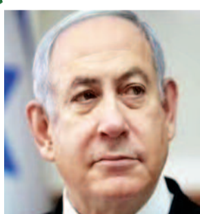
कार्यक्रम पर बातचीत के लिए ब्रिटेन, फ्रांस और जर्मनी से मिलने वाला है। इसके पीछे का कारण यह है कि तीनों देशों की सरकारों ने संयुक्त राष्ट्र परमाणु निगरानी संस्था द्वारा तेहरान की निंदा करवाने के लिए अमेरिका के साथ हाथ मिला लिया है। पिछले सप्ताह की फटकार के बाद तेहरान ने एक विद्रोही प्रतिक्रिया व्यक्त की थी। मगर, उसके

यरुशलम। बीते एक साल से ज्यादा समय से इस्राइल और हमास के बीच जंग जारी है। वहीं, इस युद्ध की लपटें लेबनान और ईरान तक पहुंच चुकी हैं। हालांकि, शांति की एक पहल के रूप में इस्राइल और हिजबुल्ला ने शुरूआती दो महीने के लिए युद्ध विराम कर लिया है इस बीच, ईरान और इस्राइल के बीच तनावति दिख रही है। एक तरफ तेहरान धमकी दे रहा है कि अगर पश्चिमी देशों ने उस पर फिर से प्रतिबंध लगाए तो वह परमाणु हथियार हासिल करने पर लगे प्रतिबंध को खत्म कर सकता है। वहीं, इस पर इस्राइली प्रधानमंत्री बेजालिन नेतन्याहू ने भी साफ-साफ कह दिया कि वह ईरान को रोकने के लिए 'सब कुछ' करेंगे। ईरान शुक्रवार को अपने परमाणु