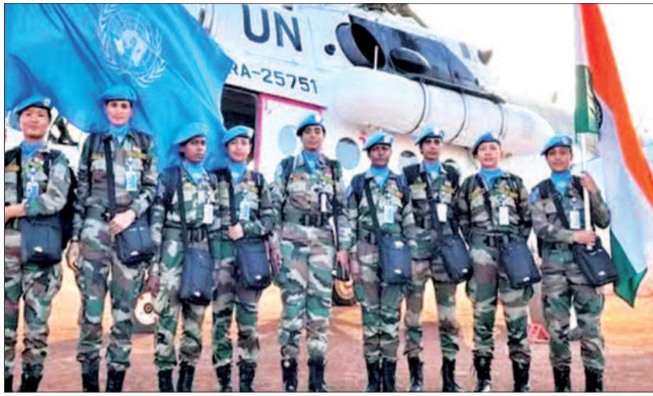
देश हैं, जिनमें संयुक्त राष्ट्र महासभा, सुरक्षा परिषद और आर्थिक और सामाजिक परिषद के सदस्य देश शामिल हैं। शीर्ष वित्तीय योगदानकर्ता देश और शीर्ष सैन्य योगदानकर्ता देश भी इसके सदस्य हो सकते हैं।

न्यूयॉर्क। भारत को संयुक्त राष्ट्र के शांति स्थापना मिशन में फिर से निर्वाचित किया गया है। भारत का यह निर्वाचन 2025-26 की समयवधि के लिए हुआ है। दरअसल भारत को मौजूदा कार्यकाल 31 दिसंबर को समाप्त हो रहा है। भारत के निर्वाचन पर संयुक्त राष्ट्र में भारत के राजदूत ने सोशल मीडिया पर साझा एक पोस्ट में लिखा कि 'एक संस्थापक सदस्य और यूएन शांति स्थापना मिशन में प्रमुख योगदानकर्ता के रूप में, भारत वैश्विक शांति और स्थिरता की दिशा में काम करने के लिए शांति स्थापना मिशन के साथ अपने जुड़ाव को जारी रखने के लिए प्रतिबद्ध है।' उल्लेखनीय है कि शांति स्थापना आयोग एक अंतर-सरकारी सलाहकार निकाय है, जो संघर्ष प्रभावित देशों में शांति प्रयासों का समर्थन करता है। शांति स्थापना आयोग में 31 सदस्य