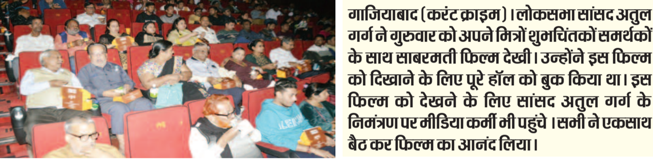
गाजियाबाद (करंट क्राइम)। लोकसभा सांसद अतुल गर्ग ने गुरुवार को अपने मित्रों शुभचिंतकों समर्थकों के साथ साबरमती फिल्म देखी। उन्होंने इस फिल्म को दिखाने के लिए पूरे हॉल को बुक किया था। इस फिल्म को देखने के लिए सांसद अतुल गर्ग के निमंत्रण पर मीडिया कर्मी भी पहुंचे। सभी ने एकसाथ बैठ कर फिल्म का आनंद लिया।