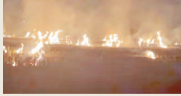
अफ्रीकी देशों में होती हैं। आग के बाद फैले प्रदूषण से जिन देशों में मौतों का रिकॉर्ड सबसे ज्यादा है, उनमें एक नाम भारत का भी है।

प्रदूषण के लिए भारत-चीन से मुआवजे की मांग मिस्र के शर्म अल-शेख में चल रहे संयुक्त राष्ट्र जलवायु शिखर सम्मेलन सीओपी-27 के दौरान भारत और चीन से मुआवजे की मांग की गई है। द्वीपीय देश एट्यूगुआ और बारबुडा के प्रधानमंत्री गैस्टन ब्राउन ने कहा, बड़े पैमाने पर प्रदूषण के लिए जिम्मेदार अर्थव्यवस्थाएं, जिनमें चीन और भारत भी शामिल हैं। इन्हें जलवायु परिवर्तन से आने वाली आपदाओं के बाद देशों के पुनर्निर्माण के लिए जलवायु मुआवजा देना चाहिए।