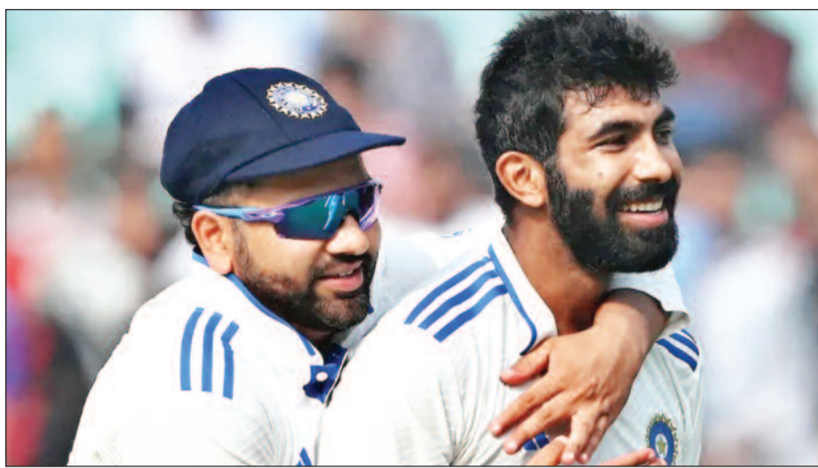
रोहित शर्मा और जसप्रीत बुमराह का संवाद।

ईएसपीएनक्रिकइन्फो की रिपोर्ट के अनुसार, रोहित 6 दिसंबर से एडिलेड में शुरू होने वाले दूसरे टेस्ट मैच से पहले भारतीय टीम के साथ जुड़ेंगे। अपने दूसरे बच्चे के जन्म के चलते रोहित ने भारत में ही रहने का फैसला किया था। उनकी अनुपस्थिति में टेस्ट टीम के उप-कप्तान जसप्रीत बुमराह कप्तानी करेंगे। बुमराह ने इससे पहले 2022 में एजवेल्टन में रोहित के कोरोना से संक्रमित होने के बाद भी टेस्ट में भारतीय टीम की अगुवाई की थी।