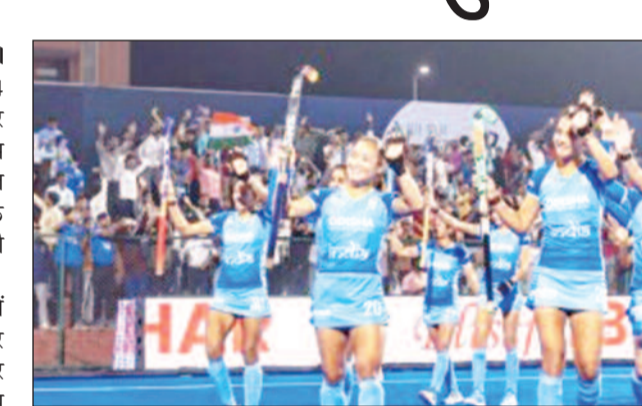
भारत की महिला हॉकी टीम का जीत का क्षण।

राजगीर (बिहार), 18 नवंबर। महिला एशियाई चैंपियंस ट्रॉफी 2024 में भारत का प्रदर्शन अब तक शानदार रहा है। लगातार जीत के साथ टीम सेमीफाइनल में पहुंच चुकी है। भारत और जापान के बीच रोमांचक सेमीफाइनल मुकाबले के लिए संघ भी सज चुका है।