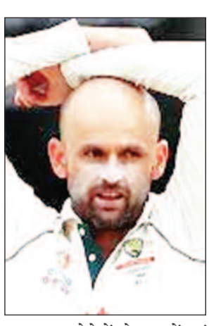
नाथन लियोन का चेहरा।

पर्यटन, 18 नवंबर। बॉर्डर-गावस्कर ट्रॉफी सीरीज में ऑस्ट्रेलिया ने लगभग दस साल से भारत के खिलाफ घरेलू सरजमीं पर सफलता का स्वाद नहीं चखा है, लेकिन अनुभवी ऑफ स्पिनर नाथन लियोन इस बार अपनी टीम की संभावनाओं को लेकर पॉजिटिव हैं।