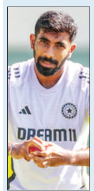
रोहित शर्मा का चेहरा।

नई दिल्ली, 18 नवंबर। टीम इंडिया बॉर्डर-गावस्कर ट्रॉफी शुरू होने से पहले पर्यटन में जमकर पसीना बहा रही है। भारतीय टीम लगातार तीसरी बार ऑस्ट्रेलिया को उसके घर पर हराकर हैट्रिक पूरा करने का सपना देख रही है। लेकिन इस बार कुछ चीजें भारत के पक्ष में नहीं हैं।