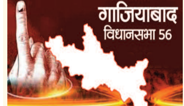
गाजियाबाद विधानसभा 56

गाजियाबाद (करंट क्राइम) । चुनाव का मौसम आता है तो चुनावी माहौल में कई तरह के रंग बिखर जाते हैं। कहीं होर्डिंग बैनर को बहार होती है तो कहीं चुनावी दफ्तर कार्यकर्ताओं से गुलजार रहता है। चुनाव के कार्यकर्ता अपना काम करते हैं और चुनाव से जुड़ी निर्वाचन वाली टीमों अपना काम करती हैं। वो इस बात पर निगाह रखती हैं कि कहीं भी भाजपा सहिता का उल्लंघन ना हो रहा हो। जो कार्यक्रम हो रहे हैं जो जनसभाएं हो रही हैं उनकी विधिवत परमिशन ली गई हो। इसके अलावा चुनावों के दौरान एक टीम वो होती है इस स्टैटिक टीम कहा जाता है। चुनाव में धनबल का प्रयोग ना हो उसके लिए यह टीम लगातार चौकिस आभियान चलाती हैं और अक्सर ये होता है कि चुनावों के दौरान नकदी ले जा रहे लोग इन टीमों के द्वारा पकड़े जाते हैं। लेकिन चुनाव में अब कुछ दिन रह गये हैं लेकिन अभी तक कोई भी उम्मीदवार ऐसा नहीं मिला जिसके समर्थकों के पास से नकदी बरामद हुई हो। कोई कारोबारी नहीं पकड़ा गया है। ये माना