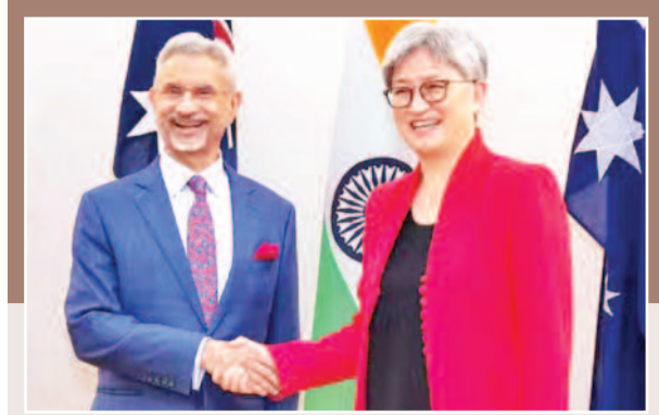
पेन्नी वॉंग से मुलाकात कर बोले जयशंकर