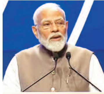
पीएमजेएवाई के तहत किसी भी सूचीबद्ध अस्पताल में पांच लाख रुपये तक का मुफ्त इलाज करा सकेगा। मौजूदा योजना के लाभार्थियों में 49 फीसदी महिलाएँ हैं। स्वास्थ्य मंत्रालय ने पहले बताया था कि इस योजना के तहत आम जनता को 1 लाख करोड़ रुपये से अधिक का लाभ हुआ है।

नई दिल्ली। प्रधानमंत्री नरेंद्र मोदी 70 वर्ष और उससे अधिक उम्र के नागरिकों को दिवाली से पहले स्वास्थ्य बीमा की सौगात देंगे। पीएम मोदी मंगलवार को वरिष्ठ नागरिकों के लिए आयुष्मान भारत प्रधानमंत्री जन आरोग्य योजना (एबी पीएमजेएवाई) की शुरुआत करेंगे। प्रधानमंत्री नरेंद्र मोदी 70 वर्ष और उससे अधिक उम्र के नागरिकों को दिवाली से पहले स्वास्थ्य बीमा की सौगात देंगे। पीएम मोदी मंगलवार को वरिष्ठ नागरिकों के लिए आयुष्मान भारत प्रधानमंत्री जन आरोग्य योजना (एबी पीएमजेएवाई) की शुरुआत करेंगे। इससे करीब 4.5 करोड़ परिवारों के लगभग छह करोड़ नागरिकों को लाभ होगा। अधिकारिक सूत्रों ने बताया कि इस योजना के तहत गरीब हो या अमीर, 70 वर्ष या उससे अधिक उम्र का प्रत्येक व्यक्ति आयुष्मान कार्ड पाने के लिए पात्र है। विस्तारित योजना शुरू होने पर वरिष्ठ नागरिक एबी