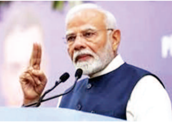
पीएम मोदी ने स्पेन के प्रधानमंत्री पेद्रो सांचेज के साथ मिलकर वडोदरा में टाटा एयरक्राफ्ट कॉम्प्लेक्स का उद्घाटन किया, जो विमान क्षेत्र में 'मेक इन इंडिया' पहल के लिए एक प्रमुख मील का पत्थर साबित होगा।

वडोदरा । प्रधानमंत्री नरेंद्र मोदी और स्पेन के प्रधानमंत्री पेद्रो सांचेज ने वडोदरा में टाटा एडवॉन्स सिस्टम्स लिमिटेड परिसर में सी-295 विमान निर्माण के लिए टाटा एयरक्राफ्ट कॉम्प्लेक्स का संयुक्त रूप से उद्घाटन किया। इस मौके पर उन्होंने स्पैनिश फुटबॉल का भी जिक्र किया। पीएम मोदी ने कार्यक्रम में अपने भाषण के दौरान कहा, स्पेन की फुटबॉल को भारत में काफी पसंद किया जाता है। क्लब रियल मैड्रिड और बार्सिलोना के बीच मैच हुआ और इस पर भारत में भी चर्चा हुई। बार्सिलोना की शानदार जीत यहां भी चर्चा का विषय रही। मैं आपको यह भी बता सकता हूँ कि भारत में दोनों क्लबों के प्रशंसकों के बीच उत्तनी ही हंसी-मजाक हुई, जितनी स्पेन में होती है। पीएम मोदी ने स्पेन के प्रधानमंत्री