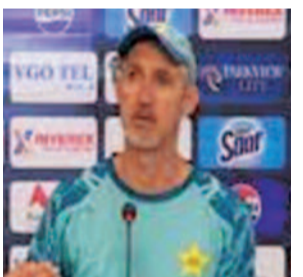
जेसन गिलेस्पी को पाकिस्तान क्रिकेट टीम के नए वनडे और टी20 कोच नियुक्त किया गया है।

लाहौर । पाकिस्तान क्रिकेट बोर्ड (पीसीबी) ने ऑस्ट्रेलिया के खिलाफ सीमित ओवरों की सीरीज के लिए जेसन गिलेस्पी को मुख्य कोच नियुक्त किया है। गैरी कस्टर्न ने पाकिस्तान क्रिकेट टीम कोच के पद से इस्तीफा दे दिया है, जिसे बोर्ड ने सोमवार को आधिकारिक रूप से स्वीकार कर लिया और आगामी दौरे के लिए सीमित ओवरों की देखरेख जेसन गिलेस्पी को सौंपी। पीसीबी ने एक्स पर पोस्ट किया, "गैरी कस्टर्न ने अपना इस्तीफा दे दिया है, जिसे स्वीकार कर लिया गया है। जेसन गिलेस्पी अगले महीने ऑस्ट्रेलिया दौरे पर पाकिस्तान क्रिकेट टीम को कोचिंग देंगे।" कस्टर्न ने केवल छह महीने के कार्यकाल के बाद ही इस्तीफा दे दिया है। रिपोर्ट्स के मुताबिक, कस्टर्न और पीसीबी के बीच मतभेद थे। ये मतभेद खासकर टीम चयन और ऑस्ट्रेलिया-जिंबाब्वे के खिलाफ आगामी सीरीज