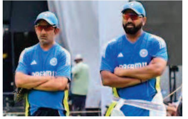
विराट कोहली और रोहित शर्मा वानखेड़े में टीम इंडिया के लिए लड़ रहे हैं।

नई दिल्ली । टीम इंडिया को न्यूजीलैंड के खिलाफ पुणे टेस्ट मैच में हार का सामना करना पड़ा। इस हार के साथ ही भारत ने न्यूजीलैंड के खिलाफ टेस्ट सीरीज गंवा दी और कई अनचाहे रिकॉर्ड अपने नाम किए। यह हार केवल यहीं तक सीमित नहीं रही, इसका प्रभाव टीम के मनोबल से लेकर विश्व टेस्ट चैंपियनशिप की अंक तालिका तक पड़ा है। अब रोहित एंड कंपनी के सामने वानखेड़े में कीवी टीम के खिलाफ आखिरी टेस्ट मैच में न सिर्फ लाज बचाने की चुनौती होगी, बल्कि डब्ल्यूटीसी को ध्यान में रखकर मुकबला भी जीतना होगा। धरेलू सरजमीं में टीम इंडिया के फ्लॉप शो ने कई सवाल खड़े किए हैं। इसके घेरे में कोच, कप्तान और अनुभवी बल्लेबाजी विराट कोहली भी हैं। न्यूजीलैंड के खिलाफ न तो गंभीर की कोचिंग काम आई और न ही कप्तान रोहित शर्मा की रणनीति। जबकि, विराट कोहली बल्ले से