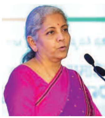
एक बयान में इसकी पुष्टि की। मंत्रालय ने कहा कि, इस वृद्धि के उद्देश्य हम मुद्रा योजना के समग्र उद्देश्य को आगे बढ़ाना चाहते हैं। इस

नई दिल्ली। वित्त मंत्री निर्मला सीतारमण ने 23 जुलाई 2024 को केंद्रीय बजट 2024-25 पेश करते हुए कहा था कि प्रधानमंत्री मुद्रा योजना (पीएमएमवाई) के तहत सीमा मौजूदा 10 लाख रुपये से बढ़ाकर 20 लाख रुपये की जाएगी। सरकार की ओर से अब इसकी अधिसूचना जारी कर दी गई है। आइए इस रिपोर्ट में सरकार के इस फैसले के बारे में विस्तार से जानें। सरकार ने देश में उद्यमिता को बढ़ावा देने के लिए प्रधानमंत्री मुद्रा योजना (पीएमएमवाई) के तहत ऋण सीमा दोगुनी कर 20 लाख रुपये कर दी है। वित्त मंत्रालय ने शुक्रवार को जारी