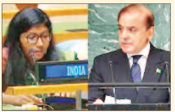
संयुक्त राष्ट्र में भारत ने पड़ोसी देश को लाताड़ा, कहा-