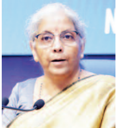
शौकत मिर्ज़ियोयेव से मुलाकात करने की उम्मीद है। यात्रा के दौरान, केन्द्रीय वित्त मंत्री भारत और उज्बेकिस्तान के बीच एक द्विपक्षीय निवेश संधि

नई दिल्ली। केन्द्रीय वित्त मंत्री निर्मला सीतारमण 24-28 सितंबर को मध्य एशियाई देश उज्बेकिस्तान का दौरा करेंगी। इस दौरान वह एशियन इन्फ्रास्ट्रक्चर इन्वेस्टमेंट बैंक (एआईआईबी) के गवर्नर मंडल की नौवीं वार्षिक बैठक में भाग लेंगी। साथ ही इस आधिकारिक यात्रा में दोनों देशों के बीच एक द्विपक्षीय निवेश संधि पर हस्ताक्षर किए जाएंगे। वित्त मंत्रालय की ओर से जारी किए गए बयान के मुताबिक, वित्त मंत्री सीतारमण की ओर से विदेश यात्रा के दौरान उज्बेकिस्तान, कतर, चीन और एआईआईबी के अध्यक्ष के साथ द्विपक्षीय बैठक की जाएगी। वित्त मंत्री इस मीटिंग में एआईआईबी में भारत के गवर्नर के तौर पर हिस्सा लेंगी।