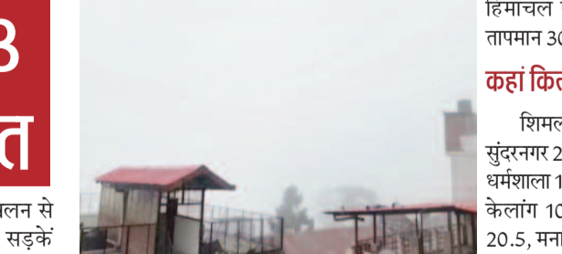
अलावा एक पुल व नौ ट्रांसफार्मर भी ठप रहे।

शिमला। राज्य में जगह-जगह भूस्खलन से मंगलवार सुबह 10:00 बजे तक 23 सड़कें आवाजाही के लिए बाधित रही। इसके अलावा एक पुल व नौ ट्रांसफार्मर भी ठप रहे। हिमाचल प्रदेश में मौसम फिर बिगड़ने के आसार हैं। राज्य के कई भागों में भारी बारिश का अलर्ट जारी किया गया है। मौसम विज्ञान केंद्र शिमला के अनुसार राज्य के कई भागों में 26 व 27 सितंबर को बारिश होने का पूर्वानुमान है। 26 सितंबर के लिए भारी बारिश का अलर्ट जारी किया गया है। कुछ स्थानों पर 29 सितंबर तक मौसम खराब बना रहने की संभावना है। 30 सितंबर से मौसम फिर साफ रहने के आसार हैं। उधर, राज्य में जगह-जगह भूस्खलन से मंगलवार सुबह 10:00 बजे तक 23 सड़कें आवाजाही के लिए बाधित रही। इसके