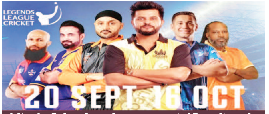
लीजेंड्स लीग क्रिकेट जोधपुर के बरकतुल्ला खां स्टेडियम में शुरू होगा

जोधपुर। लीजेंड्स लीग क्रिकेट 20 सितंबर से जोधपुर के बरकतुल्ला खां स्टेडियम में शुरू होने जा रहा है। इसको लेकर जहां क्रिकेट फैंस के बीच उत्साह है, वहीं यहां की क्रिकेट एसोसिएशन तैयारियों को पुख्ता और अंतिम रूप देने में जुटी हुई है।