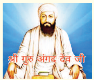
श्री गुरु अंगद देव जी

गाजियाबाद, करंट क्राइम। पंजाबी (गुरमुखी: ਪੰਜਾਬੀ, शाहमुखी: پنجاب) एक हिंद-आर्यन भाषा है और ऐतिहासिक पंजाब क्षेत्र (अब भारत और पाकिस्तान के बीच विभाजित) के निवासियों तथा प्रवासियों द्वारा बोली जाती है। इसके बोलने वालों में सिख, मुसलमान और हिंदू सभी शामिल हैं। पाकिस्तान को 1998 की जनगणना और 2001 की भारत की जनगणना के अनुसार, भारत और पाकिस्तान में भाषा के कुल वक्ताओं की संख्या लगभग 9-13 करोड़ है, जिसके अनुसार यह विश्व की 11वीं सबसे व्यापक भाषा है। कम से कम पिछले 300 वर्षों से लिखित पंजाबी भाषा का मानक रूप, माझी बोली पर आधारित है, जो ऐतिहासिक माझा क्षेत्र की भाषा है। पंजाबी भाषा पंजाब की आधुनिक भारतीय भाषा आर्यभाषा है। ग्रियर्सन ने (लिग्विस्टिक सर्वे भाग 1, 8 तथा 9 में) पूर्वी पंजाबी को 'पंजाबी' और पश्चिमी पंजाबी को 'लहिंदा' कहा है। वास्तव में पूर्वी पंजाबी और पश्चिमी पंजाबी पंजाबी की दो उपभाषाएं हैं जैसे पूर्वी हिंदी और पश्चिमी हिंदी हिंदी की। यह अलग बात है कि पाकिस्तान बन जाने के कारण दोनों भाषाओं का विकास इतनी भिन्न दिशाओं में हो रहा है कि इनके अलग-अलग भाषाएं हो जाने की संभावना है।