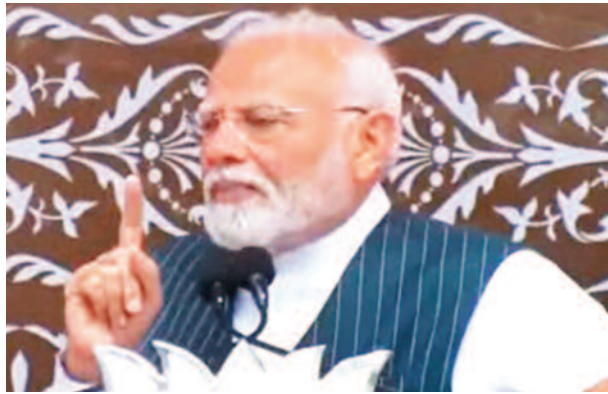
का निर्माण करेंगे। और यह मोदी की गारंटी है। परिवारवाद ने जम्मू-कश्मीर को खोखला किया है। जम्मू-कश्मीर विदेशी ताकतों के निशाने पर है। आप

जम्मू-कश्मीर। कश्मीर फतह के लिए पीएम मोदी ने 'मिशन कश्मीर' शुरू कर दिया है। पीएम मोदी ने आज जम्मू-कश्मीर में चुनावी शंखनाद किया। डोडा स्पोर्ट्स स्टेडियम में पीएम मोदी चुनावी रैली को संबोधित कर रहे हैं। इस दौरान उन्होंने कहा कि वर्तमान में जम्मू-कश्मीर विकास की नई गाथा लिख रहा है। इस बार का विधानसभा चुनाव जम्मू-कश्मीर का भाग्य तय करने वाला है। मैं आपके इस प्यार और आशीर्वाद का बदला आपके और देश के लिए दोगुनी-तिगुनी मेहनत करके चुकाऊंगा। हम सब मिलकर एक सुरक्षित और समृद्ध जम्मू-कश्मीर