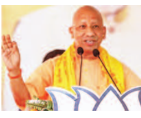
गोरखपुर, प्रयागराज, झांसी मंडलों के 270 से अधिक स्थानीय व पारंपरिक उत्पादों के उद्यमियों ने विभिन्न कैटेगरीज के अंतर्गत अब तक रजिस्ट्रेशन करा लिया है। आने वाले दिनों में इस प्रक्रिया में और तेजी आएगी। रजिस्ट्रेशन कराने वाले उद्यमी हथकरघा, टेराकोटा,

लखनऊ। उत्तर प्रदेश को 'उद्यम प्रदेश' बनाने के लिए योगी सरकार प्रतिबद्ध है। मुख्यमंत्री योगी आदित्यनाथ एक तरफ जहां स्वयं प्रत्येक मंच से प्रदेश के उत्पादों की अक्सर ब्रांडिंग करते रहते हैं। वहीं, दूसरी तरफ शासन को निर्देशित कर विभिन्न आयोजनों के माध्यम से यहां के उद्यमियों को अपने उत्पाद की ब्रांडिंग का अवसर भी उपलब्ध कराते हैं। इस कड़ी में 25 से 29 सितंबर के बीच आयोजित होने जा रहा यूपी इंटरनेशनल ट्रेड शो-2024 (यूपीआईटीएच-2024) प्रदेश के पारंपरिक उद्यमियों के लिए 'वैश्विक महाकुंभ' साबित होगा। इस क्रम में, वाराणसी, अयोध्या,