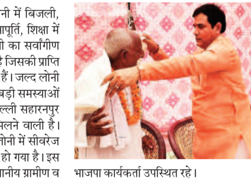
भाजपा कार्यकर्ता उपस्थित रहे।