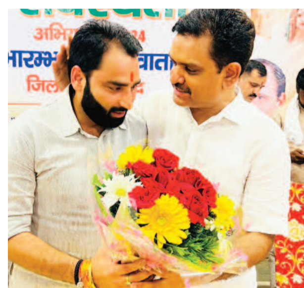
नागरिक को भाजपा की सदस्यता दिलाने का संकल्प लिया।