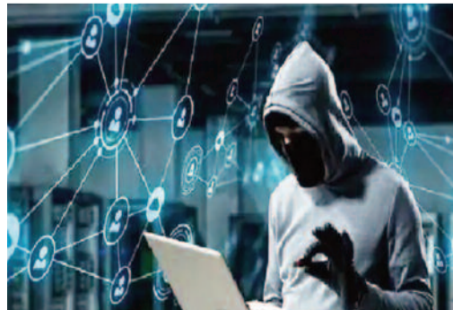
साइबर क्राइम थाने में दर्ज दस केस और पोर्टल से दबोचा है। इसमें से ज्यादातर वे आरोपी हैं जिन्होंने टग गिरफ्तो को कमीशन पर अपना खाता उपलब्ध कराया है।

नोएडा। नोएडा में साइबर क्राइम थाने की पुलिस ने अगस्त महीने में आए 22 मामलों में चार करोड़ 81 लाख रुपए फ्रिज करार पीड़ितों को वापस कराए हैं। इस दौरान 12 जालसाज को दबोच कर पुलिस ने सलाखों के पीछे भी भेजा है। टगी के शुरूआती घंटों में जिस पीड़ित ने मामले की शिकायत पुलिस से की उसकी 50 प्रतिशत से अधिक की रकम को पुलिस ने बैंक अधिकारियों से बात करके स्थापित कर फ्रिज करा दिया है। टगी होने पर देरी न करते हुए तत्काल 1930 पर अवगत कराए। ताकि पैसों को फ्रिज कराया जा सके। साइबर क्राइम थाने के प्रभारी ने बताया कि साइबर टगी के मामले लगातार सामने आ रहे हैं। टगी की शिकायत मिलते ही उन खातों को फ्रिज कराने का प्रयास किया जाता है, जिसमें टगी की रकम ट्रांसफर होती है। अगस्त में पुलिस को इसमें उल्लेखनीय सफलता मिली है।