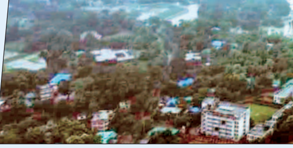
सोमा से सटे हैं, जहां क्रमशः 14 और 23 लोगों की मौत हुई है। सरकार के अनुसार बांग्लादेश के डेल्टा क्षेत्र और ऊपरी भारतीय क्षेत्रों में मानसूनी बारिश से आई बाढ़ ने देश में लगभग दो सप्ताह तक कहर बरपाया, जिसकी वजह से लोगों और सैकड़ों मवेशियों की मौतें हुईं। इसकी वजह से लाखों लोगों को विस्थापित होना पड़ा और उनकी संपत्ति का नुकसान भी हुआ। बता दें कि बांग्लादेश में करीब 200 नदियां बहती हैं, जिसमें से 54

ढाका। पहले आरक्षण को लेकर हिंसा, फिर सरकार विरोधी प्रदर्शन और राजनीतिक अस्थिरता के बाद अब बांग्लादेश में प्रकृति का क्रूर चेहरा सामने आ रहा है। बांग्लादेश में अंतरिम सरकार का गठन हुआ, जिनकी देश में राजनीतिक स्थिरता को कायम करना प्रमुख प्राथमिकता थी, लेकिन प्रकृति के तांडव ने उनकी मुश्किलों को और बढ़ा दिया है। अंतरिम सरकार की तरफ से जारी किए गए रिपोर्ट के अनुसार देश में बाढ़ से अब तक 59 लोगों, जिसमें छह महिलाएं और 12 बच्चे शामिल हैं, की मौत हो चुकी है। जबकि इस विनाशकारी बाढ़ की वजह से पांच लाख से ज्यादा लोग प्रभावित हुए हैं। आपदा प्रबंधन एवं राहत मंत्रालय ने बाढ़ की स्थिति पर जानकारी देते हुए कहा कि सबसे अधिक मौतें कुमिला और फेनी जिलों में हुई हैं, जो कि भारत के पूर्वोत्तर भाग में त्रिपुरा की