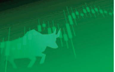
ऑल-टाइम हाई 42,712 बनाया है। लाजकैप की तुलना में मिडकैप और स्मॉलकैप शेयरों में हल्की तेजी है।

मुंबई। भारतीय शेयर बाजार के लिए बुधवार का कारोबारी सत्र अब तक मुनाफे वाला रहा है। आईटी शेयरों में तेजी के कारण निफ्टी ऑल-टाइम हाई पर कारोबार पर रहा है। अब तक के कारोबार में निफ्टी ने 25,114 का नया ऑल-टाइम हाई बनाया है, जो कि पहले 25,078 था। दोपहर 1:46 पर संसेक्स 253 अंक या 0.29 प्रतिशत की तेजी के साथ 81,964 और निफ्टी 83 अंक या 0.34 प्रतिशत की बढ़त के साथ 25,102 पर था। शेयर बाजार में तेजी की वजह आईटी शेयरों में रेली है। इसके कारण निफ्टी आईटी इंडेक्स ने भी नया