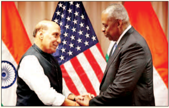
अमेरिकी कंपनियों को भारत आने का न्योता