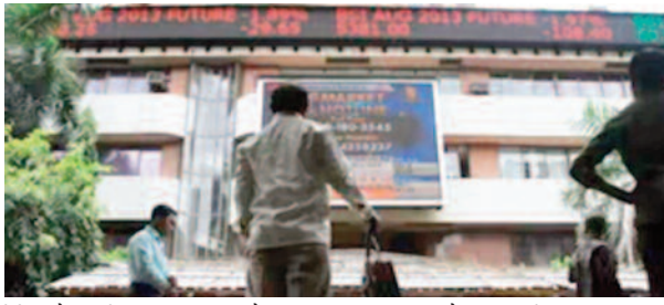
मैनेजी है। अंटी, फार्मा, रियल्टी और एनर्जी इंडेक्स में दबाव के साथ कारोबार हो रहा है। सेंसेक्स पैक में भी खरीदारी देखी जा रही है। निफ्टी बैंक 134 अंक या 0.27 प्रतिशत बढ़कर 50,820 पर बना हुआ है। छोटे और मझोले शेयरों में भी तेजी है। निफ्टी मिडकैप 100 इंडेक्स 279 अंक या 0.48 प्रतिशत की बढ़त के साथ 58,715 और

मुंबई। भारतीय शेयर बाजार गुरुवार के कारोबारी सत्र में सकारात्मक खुला। बाजार के करीब सभी सूचकांकों में तेजी के साथ कारोबार हो रहा है। सुबह 9:25 पर सेंसेक्स 145 अंक या 0.18 प्रतिशत बढ़कर 81,046 और निफ्टी 44 अंक की बढ़त के साथ 24,815 पर था। बाजार में रुझान भी तेजी का है। नेशनल स्टॉक एक्सचेंज (एनएसई) पर 1730 शेयर हरे निशान में और 423 शेयर लाल निशान में हैं। सबसे अधिक तेजी आईटी और एफएमसीजी शेयरों में देखने को मिल रही है। निफ्टी आईटी इंडेक्स 0.42 प्रतिशत और निफ्टी एफएमसीजी इंडेक्स में 0.48 प्रतिशत की तेजी है। इसके अलावा नेशनल स्टॉक एक्सचेंज (एनएसई) पर पीएसयू बैंक, एफएमसीजी, मेटल और मीडिया इंडेक्स