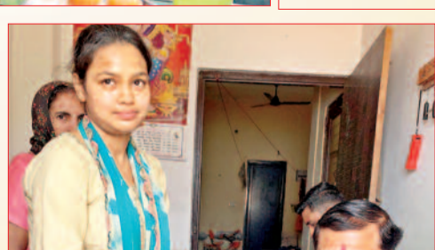
विजय उपाध्याय और उनकी बहन