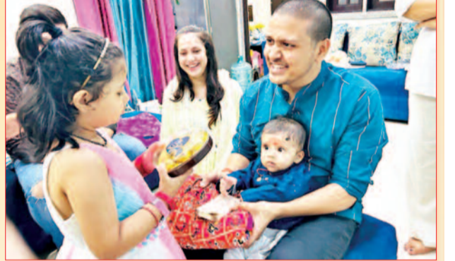
आदविक गिरि और बहने