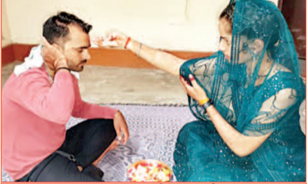
विकास बहन विधि भाई को राखी बांधते हुए