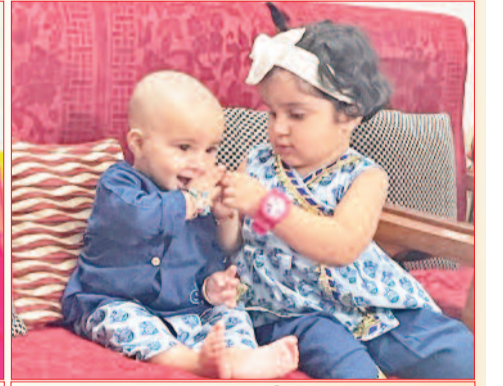
बहन आख्या भाई देवविराट