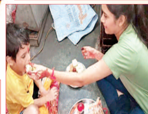
गौपी और सगुन