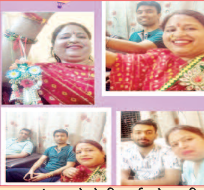
बहन रंजना ने भेजी भाई को राखी