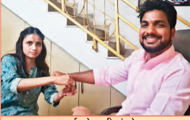
नमन भाई को राखी बांधते हुए