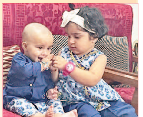
आव्या और देवव्रत