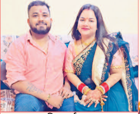
सूरिट भाई सुभम