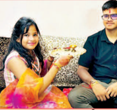
अंश बहन माही