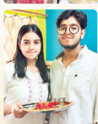
गोरी व कृष्णा