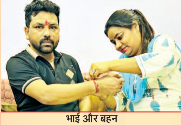
भाई और बहन