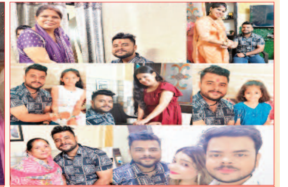
भाई अभिषेख सक्सेना और बहने