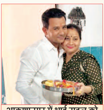
आकाशनगर में भाई राहुल को तिलक लगाने के बाद पूजा