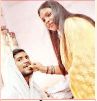
लक्ष्मी व पूजा