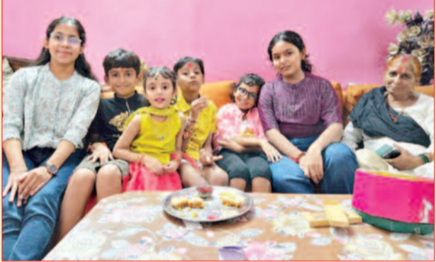
यथार्थ, वंशिका और भाई