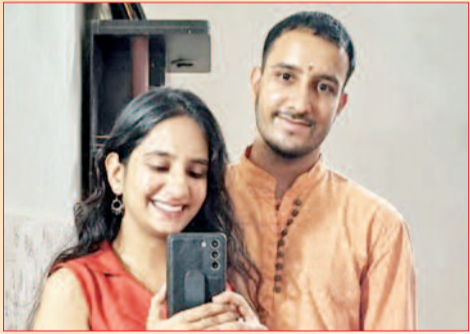
रक्षाबंधन रिशतों का एक सुखद बंधन है। भाई-बहन के प्रेम के प्रतीक इस पावन पर्व की आप सभी को हार्दिक शुभकामनाएँ।