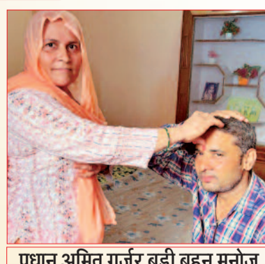
प्रधान अमित गुर्जर बड़ी बहन मनोज नगर सादात नगर इकला