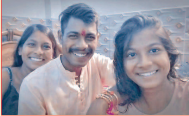
प्रिंस, निक्की, निष्पु