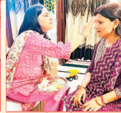
चित्रा और गरिमा