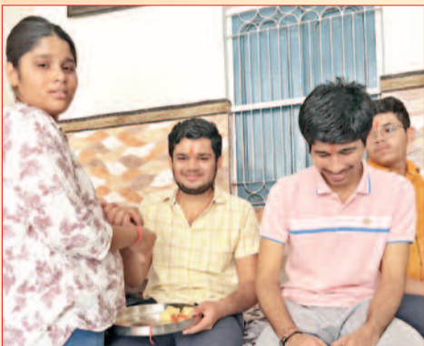
अंशिका और भाई