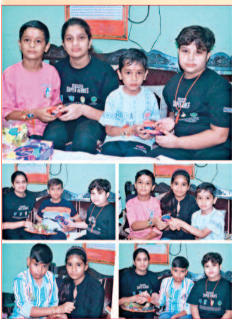
परी ने भाईयों को बांधी राखी