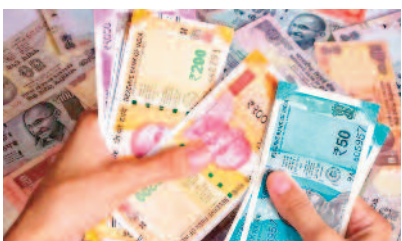
जिन निवेशकों का नाम कंपनी के रिकॉर्ड डेट बुक में रहेगा उन्हें ही बोनस शेयर का लाभ मिलेगा। 2 महीने में दूसरी बार बोनस शेयर दे रही है कंपनी पीवीपी इंफ्रा लिमिटेड दूसरी बार बोनस शेयर देने जा रही है। इसी साल 21 जून को कंपनी एक्स-बोनस स्टॉक के तौर पर ट्रेड की थी। तब कंपनी ने 5

नई दिल्ली। बोनस शेयर बांटने वाली कंपनियों पर दांव लगाने वाले निवेशकों के लिए गुड न्यूज है। इस हफ्ते शेयर बाजार में पीवीपी इंफ्रा लिमिटेड एक्स-बोनस स्टॉक के तौर पर ट्रेड करने वाला है। कंपनी ने एक शेयर पर एक शेयर बोनस देने का ऐलान किया है। बता दें, शुक्रवार को कंपनी के शेयरों में अपर सर्किट लगा था। इसके बाद भी शेयरों का भाव 20 रुपये से कम का ही है।