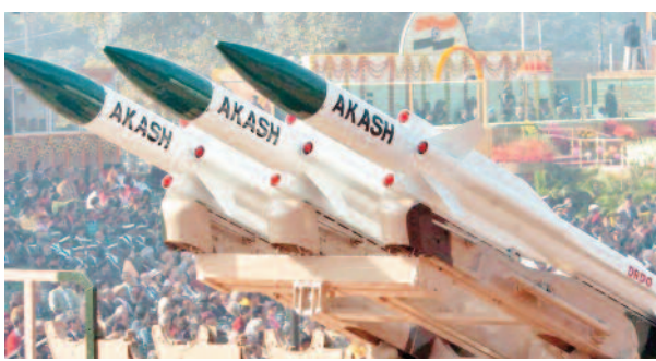
अपना रिकॉर्ड खंगालेगी। बीएसई पर उपलब्ध डाटा के अनुसार कंपनी इस साल दूसरी बार डिविडेंड देने जा रही है। इससे पहले कंपनी फरवरी के महीने में एक्स-डिविडेंड ट्रेड की थी। तब

नई दिल्ली। सरकारी कंपनी हिंदुस्तान एयरोनॉटिक्स लिमिटेड की तरफ से निवेशकों को डिविडेंड दिया जाएगा। कंपनी इसी हफ्ते शेयर बाजारों में एक्स-डिविडेंड स्टॉक के तौर पर ट्रेड करेगी। बता दें, यह डिफेंस स्टॉक इस साल दूसरी बार डिविडेंड देने जा रहा है। किस दिन एक्स-डिविडेंड स्टॉक के तौर पर ट्रेड करेगी कंपनी? हिंदुस्तान एयरोनॉटिक्स लिमिटेड ने शेयर बाजारों को दी जानकारी में कहा है कि 5 रुपये के फेस वैल्यू वाले एक शेयर पर 13 रुपये का डिविडेंड दिया जाएगा। कंपनी ने इस डिविडेंड के लिए 21 अगस्त की तारीख को रिकॉर्ड डेट तय किया है। यानी इस दिन कंपनी