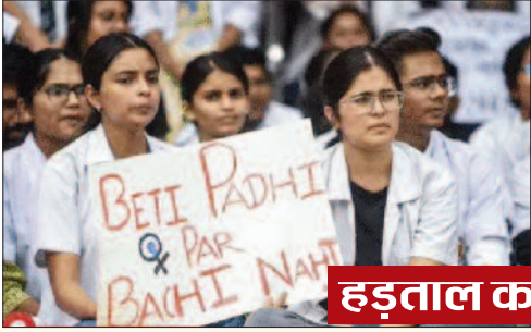
हड़ताल का देशभर में असर

नई दिल्ली। कोलकाता में ट्रेनी डॉक्टर से रेप-मर्डर की घटना के विरोध में रेजिडेंट डॉक्टरों की हड़ताल का शनिवार को 8वां दिन है। इंडियन मेडिकल एसोसिएशन (व्हाट) ने भी 24 घंटे के लिए अस्पतालों में सिर्फ इमरजेंसी सेवाएं चालू रखने की बात कही है। इस बीच, केंद्रीय स्वास्थ्य मंत्रालय ने डॉक्टरों से हड़ताल खत्म करने को कहा है। मंत्रालय ने बयान जारी कर कहा- डॉक्टरों की मांग को लेकर कमेटी बनाई जाएगी। सुरक्षा के लिए राज्य सरकारों से भी सुझाव मांगे जाएंगे। स्वास्थ्य मंत्रालय के इस फैसले के पहले व्हाट चीफ ने शनिवार को कहा- इमरजेंसी सेवाएं छोड़कर अस्पतालों में कामकाज बंद है। हमारी मांग है कि डॉक्टरों की सुरक्षा सुनिश्चित की जाए। हमने ऐसा कुछ नहीं मांगा जो सरकार नहीं कर सकती है। दरअसल, 9 अगस्त को कोलकाता के आरजी कर मेडिकल कॉलेज में ट्रेनी डॉक्टर से रेप और हत्या की गई थी। 14 अगस्त की देर रात इसी अस्पताल में हिंसा हुई, जिसके बाद व्हाट ने देशभर में प्रदर्शन का फैसला किया था।