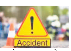
काम से मुरादनगर आए थे। वह रावली सुराना मार्ग पर टेलीफोन