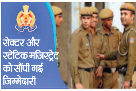
सेक्टर और स्टेटिक मजिस्ट्रेट को सौंपी गई जिम्मेदारी