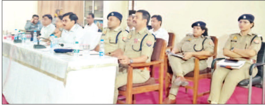
पुलिस परीक्षा संपन्न कराने वाले पुलिसकर्मी ड्यूटी का करेंगे रिहर्सल

सीपी कल्पना सक्सेना द्वारा दिशा-निर्देश दिए गए हैं। इसके साथ ही सुरक्षा का पूरा खाका भी बनाया गया है। परीक्षा के प्रश्न पत्र कड़ी सुरक्षा और सीसीटीवी की निगरानी में रहेंगे। तो परीक्षा होने के बाद उनकी पुस्तिकाओं को भी सुरक्षा के घेरे में लेकर जाया जाएगा। वहीं पुनः परीक्षा के संबंध में सेक्टर मजिस्ट्रेट और स्टेटिक मजिस्ट्रेट भी तय कर दिए गए हैं। वहीं अधिकारियों द्वारा पुलिस परीक्षा ड्यूटी में शामिल होने वाले अधिकारियों को पुस्तिका भी वितरित कर दी गई है ताकि किसी प्रकार की असुविधा न होने पाए।