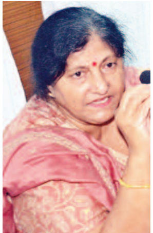
गाजियाबाद (करंट क्राइम)। इसमें कोई शक नहीं है कि जब अधिकार और हक को लेकर अफसरशाही और