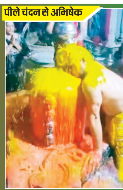
पीले चंदन से अभिषेक