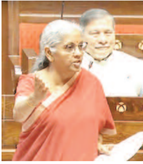
न्यूनतम बैलेंस न रखने पर राशि काटे जाने का सवाल उठाया गया है। यह नियम पीएम जन धन खातों और बेसिक सेविंग्स अकाउंट पर लागू नहीं

नई दिल्ली। वित्त मंत्री निर्मला सीतारमण की ओर से कहा गया है कि जन धन और बेसिक सेविंग्स अकाउंट में न्यूनतम अकाउंट बैलेंस रखने की आवश्यकता नहीं है। बैंक द्वारा केवल उन्हीं ग्राहकों पर जुमाना लगाया जाता है जो अपने खाते में अपेक्षित राशि बनाए रखते हैं। बैंक खातों में ग्राहकों की ओर से न्यूनतम बैलेंस न रखने के कारण 8,500 करोड़ रुपये का जुमाना सरकारी बैंकों द्वारा बीते 5 वर्षों में वसूले जाने के एक सवाल के जवाब में वित्त मंत्री ने ये बात कही। सीतारमण ने कहा कि सदन के सदस्यों की ओर से बैंकों द्वारा