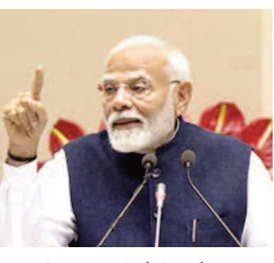
पीएम मोदी ने कहा कि भारत जल्द ही दुनिया की सबसे बड़ी अर्थव्यवस्था बन जाएगा।

नई दिल्ली। प्रधानमंत्री नरेंद्र मोदी ने मंगलवार को भारतीय उद्योग परिषद (सीआईआई) की तरफ से आयोजित कार्यक्रम को संबोधित किया। कार्यक्रम को संबोधित करते हुए पीएम मोदी ने कहा कि भारत जल्द ही दुनिया की सबसे बड़ी अर्थव्यवस्था बन जाएगा। पीएम मोदी ने कार्यक्रम को संबोधित करते हुए कहा कि मुझे याद है, महामारी के समय आप और हम चर्चा कर रहे थे और चर्चा का विषय रहता था- गेटिंग थ्रो बैक। तब मैंने आपसे कहा था कि भारत बहुत ही जल्द विकास के पथ पर दौड़ेगा। आज