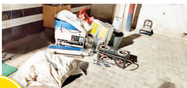
नामी कंपनी के प्रतिनिधि ने एक मकान पर छापा मारकर किया भंडाफोड़