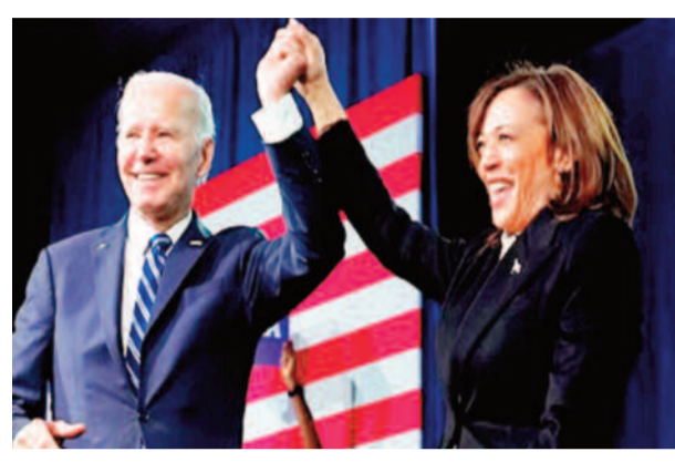
एक प्रेस कॉन्फ्रेंस के दौरान राष्ट्रपति जो बाइडन की जुबान फिसल गई थी। उन्होंने गलती से कमला हैरिस को पूर्व राष्ट्रपति ट्रम्प के रूप में उल्लेखित किया था, उन्होंने कहा, मैं ट्रम्प को उपराष्ट्रपति के रूप में नहीं चुनता, क्या मुझे लगता है कि वह राष्ट्रपति बनने के योग्य नहीं हैं।

वाशिंगटन। अमेरिका की पहली अश्वेत अमेरिकी और पहली दक्षिण एशियाई अमेरिकी और मौजूदा समय में उपराष्ट्रपति कमला हैरिस को लेकर अमेरिकी राष्ट्रपति जो बाइडन ने बड़ा बयान दिया है। जो बाइडन ने अपने बयान में कहा कि उनकी डिप्टी, उपराष्ट्रपति कमला हैरिस, देश का नेतृत्व करने के लिए योग्य हैं। एक हाई-स्टेज प्रेस कॉन्फ्रेंस में बाइडन ने कहा, शुरू से ही मैंने इस बारे में कोई संदेह नहीं किया। वह राष्ट्रपति बनने के योग्य हैं। इसलिए मैंने उन्हें चुना।