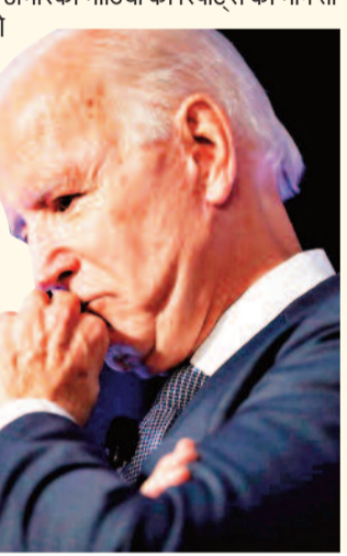
उन्होंने गलती से कमला हैरिस को पूर्व राष्ट्रपति ट्रम्प के रूप में उल्लेखित किया था, उन्होंने कहा, मैं ट्रम्प को उपराष्ट्रपति के रूप में नहीं चुनता, क्या मुझे लगता है कि वह राष्ट्रपति बनने के योग्य नहीं हैं।

मैंने उन्हें एक बार हराया और मैं उन्हें फिर से हराऊंगा। डेमोक्रेटिक पार्टी के संभावित उम्मीदवार जो बाइडन ने कहा, इस अभियान में अभी लंबा सफर तय करना है और इसलिए मैं आगे बढ़ता हूँ।