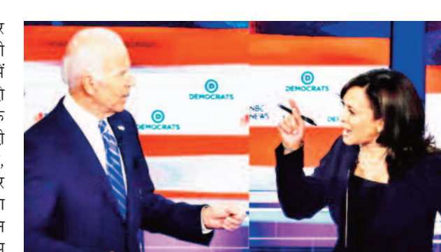
एक साथ एक मंच पर लाएगा।

वाशिंगटन। अमेरिका में पांच नवंबर को चुनाव होने वाले हैं। ऐसे में सभी राजनीतिक दल अपने प्रचार प्रसार में लगे हुए हैं। यहां राष्ट्रपति पद के लिए दो नेताओं को बाइडन और डोनाल्ड ट्रंप के बीच कड़ा मुकाबला है। दोनों ही प्रतिद्वंद्वी एक दूसरे पर हमलावर हैं। इस बीच, उपराष्ट्रपति कमला हैरिस ने एक बार फिर पूर्व राष्ट्रपति डोनाल्ड ट्रंप पर निशाना साधा है। उन्होंने कहा कि रिपब्लिकन पार्टी के संभावित उम्मीदवार ट्रंप अमेरिकी लोकतंत्र को तानाशाही में बदल देंगे।