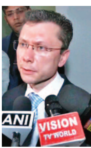
व्यापार और आर्थिक संबंधों को बढ़ाने पर चर्चा हुई।