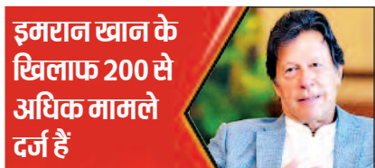
इमरान खान के खिलाफ 200 से अधिक मामले दर्ज हैं