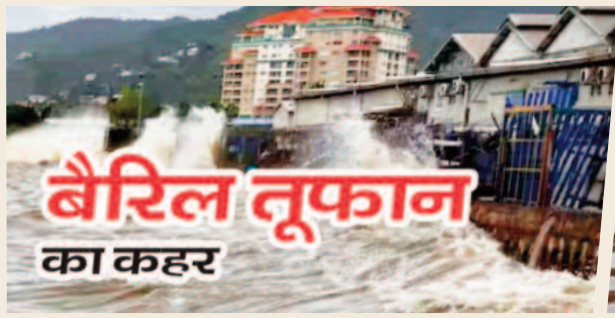
बैरिल तूफान का कहर