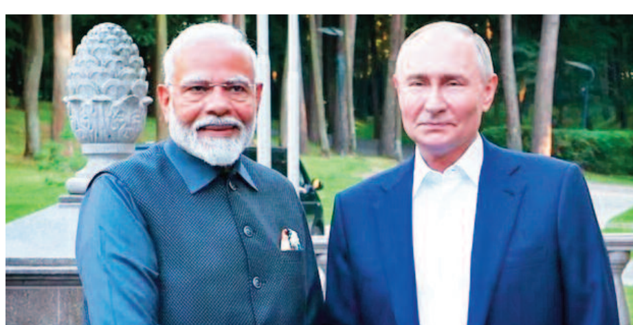
मुद्राओं का उपयोग करके द्विपक्षीय भुगतान प्रणाली को आगे बढ़ाने का निर्णय लिया। भारत की मांग पर रूस अपनी सेना में भर्ती किए भारतीय नागरिकों को वापस भेजने के लिए तैयार है। उन्होंने कहा, इस मामले में हम भारत के साथ हैं। हमें उम्मीद है कि इसे जल्द सुलझा लिया जाएगा।

देकर रूसी सेना में भर्ती करने का खुलासा हुआ था। दर्जनों भारतीय रूसी सेना में फंसे हैं और कई भारतीय रूस-यूक्रेन युद्ध में मोर्चे पर तैनात हैं।