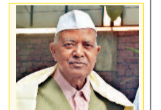
उस बैठक में मैंने कहा था कि मायावती जी और मुलायम सिंह जी के जातिवाद का मुकाबला जातिवाद से नहीं कर सकते। भाजपा को कांटे से कांटा निकालने के प्रयास से बचने की जरूरत है।

गाजियाबाद, करंट क्राइम। जब श्री नितिन गडकरी जी भाजपा के राष्ट्रीय अध्यक्ष बने तो उन्होंने उत्तर प्रदेश के कुछ कार्यकर्ताओं को एक बैठक बुलाई थी। उसमें मुझे भी जाने का अवसर मिला था। उस मीटिंग में उत्तर प्रदेश में भाजपा के पुनः 1991 की स्थिति में पहुंचाने पर विचार किया गया था। उस बैठक में मैंने कहा था कि मायावती जी और मुलायम सिंह जी के जातिवाद का मुकाबला जातिवाद से नहीं कर सकते। भाजपा को कांटे से कांटा निकालने के प्रयास से बचने की जरूरत है। इस जातिवाद का मुकाबला उदार हिंदुत्व से ही होगा। श्री राम मंदिर चाहे न बना हो लेकिन अगर हम रामराज्य की स्थापना के लिए प्रयासरत दिखते तो भी प्रदेश की जनता हम पर भरोसा करती लेकिन सरकार के प्रयास उस दिशा में नहीं दिखे इसलिए हम पिछड़ गए और जातिवादी राजनीति आगे बढ़ गई।