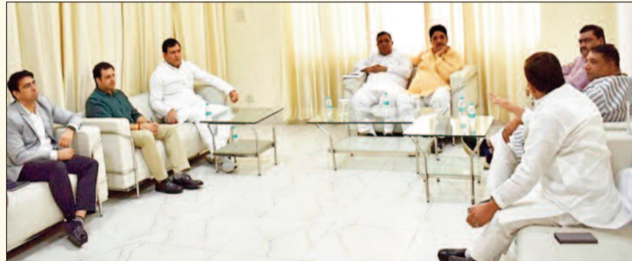
सांसद अतुल गर्ग, कैबिनेट मंत्री सुनील शर्मा ने निकाली निगम दुकानों के समाधान की राह

निगम गेस्ट हाऊस में समीक्षा बैठक में स्वच्छता, अवैध निर्माण, नक्शा पास कराने जैसी समस्याओं को लेकर बात हुई और यहाँ लोकसभा सांसद से लेकर विधायकों ने अपनी बात रखी। कैबिनेट मंत्री सुनील शर्मा द्वारा यह बैठक बुलाई गई थी। इस बैठक में जिले के स्वच्छता विकास कार्यों से सम्बन्धित विषयों पर चर्चा हुई। अवैध कॉलोनी के निर्माण पर पूर्ण रूप से रोक लगाने के निर्देश दिये गये। प्रताप विहार और इन्दिरापुरम में सीवर की समस्या के समाधान हेतु निर्देशित किया गया। मुरादनगर और धौलाना में बने कूड़ा घर को जल्द से जल्द हटाने और नई व्यवस्था करने के निर्देश दिये गये। कूड़ा निस्तारण प्लांट की संख्या बढ़ाने के निर्देश दिये गये और कैलाश मानसरोवर भवन को जल्द ही हैंडओवर करने के निर्देश दिये गये।