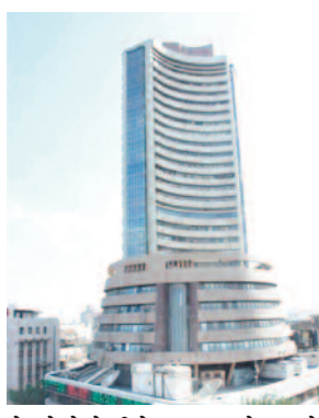
शेयरों में तेजी के साथ कारोबार हो रहा है। निफ्टी मिडकैप 100 इंडेक्स 30 अंक या 0.05 प्रतिशत की तेजी

मुंबई। भारतीय शेयर बाजार की शुरुआत शुक्रवार के कारोबारी सत्र में गिरावट के साथ हुई। बाजार में ऊपरी स्तरों से मुनाफावसूली देखने को मिल रही है। सुबह 9:20 पर सेंसेक्स 464 अंक या 0.58 प्रतिशत की गिरावट के साथ 79,585 और निफ्टी 116 अंक या 0.48 प्रतिशत की गिरावट के साथ 24,186 पर था। बैंकिंग शेयरों में गिरावट का असर सबसे ज्यादा देखा जा रहा है। निफ्टी बैंक 464 अंक या 0.87 प्रतिशत गिर कर 52,639 है। लार्जकैप की अपेक्षा मिडकैप और स्मॉलकैप