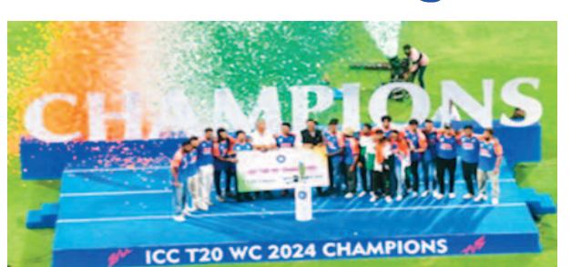
43 रनों से हराया था और ट्रॉफी पर अपना कब्जा जमाया, और जब वतन लौटी तो उस समय बीसीसीआई के पास इतना पैसा भी नहीं था कि वो टीम का ग्रैंड वेलकम कर सके। हाल यह था कि टीम को इनाम के तौर पर भेंट देने के लिए बीसीसीआई को फंड जुटाने पर भी मलबूर होना पड़ा। उस समय बीसीसीआई की मदद की थी मशहूर

तमाम मुश्किलों का सामना करने के बावजूद बीसीसीआई ने खिलाड़ियों को इनाम दिया। भारतीय बोर्ड वैश्विक क्रिकेट में एक बड़ी शक्ति है। लेकिन अपनी शुरुआती दिनों में बीसीसीआई ने काफी संघर्ष भी किया। तमाम चुनौतियों को पार करते हुए जब कपिल देव की अग्रुवाई वाली टीम इंडिया ने 1983 में विश्व चैंपियन वेस्टइंडीज को