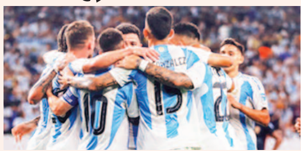
गोल का मौका दिया, लेकिन इक्वाडोर की रक्षा फिर से संगठित होने और खतरों को बेअसर करने में कामयाब रही।

ब्रुस्टन (अमेरिका)। अर्जेंटीना ने इक्वाडोर को पेनल्टी शूट आउट में 4-2 से हराकर कोपा अमेरिका कप में लगातार पांचवीं बार सेमीफाइनल में प्रवेश कर लिया। अर्जेंटीना का सेमीफाइनल में वेनेजुएला बनाम कनाडा मैच के विजेता से शुरूवार को मुकाबला होगा जो 9 जुलाई को ईस्ट रदरफोर्ड, न्यू जर्सी के मेटलाइफ स्टेडियम में खेला जाएगा। एनआरजी स्टेडियम पर मौजूदा चैंपियन के कब्जे के बावजूद, इक्वाडोर अधिक खतरनाक था, मैच के पहले तीन शॉट्स में, जिसमें सरमिंटो शॉट पर एमिलियानो मार्टिनेज द्वारा महत्वपूर्ण बचाव भी शामिल था। अर्जेंटीना के लिए पहला अच्छा मौका एंजो फर्नांडीज के माध्यम से आया: एक हेडर और एक पलटवार के बाद एक कॉर्नर मिला। मेसी के कॉर्नर से, मैक एलिस्टर के बाद लिसेंझे मार्टिनेज का दूसरा हेडर, अलेक्जेंडर डोमिंगुएज ने बचा लिया लेकिन गेंद पहले ही गोल रेखा पार कर चुकी थी। पहले हाफ के अंतिम मिनटों में, निकोलस गोंजालेज के एक प्रयास ने एल्बोसेलेस्टे को दूसरे