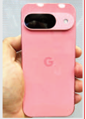
गूगल अब भारत में शुरू करेगा पिवक्सल फोन का प्रोडक्शन