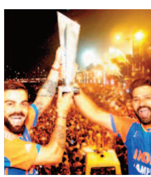
सितारों से सजी जगह खचाखच भरी हुई थी, जो रात का उनका अंतिम गंतव्य था, जहां टीम ने प्रशंसकों के साथ गाना गाया और उत्साह बढ़ाया, जिससे यह एक शानदार पल बन गया, जिसके इंतजार में 11 साल लगे। भारतीय कप्तान ने कहा, आप उत्साह का अंदाजा लगा सकते हैं,

मुंबई। विश्व कप विजेता कप्तान रोहित शर्मा और टीम इंडिया ने गुरुवार को मरीन ड्राइव पर ओपन-बस पर डे में हिस्सा लिया। यह घटना 2007 में पहले टी20 विश्व कप में टीम की जीत के बाद हुई घटना के समान थी। भव्य जश्न के बारे में अपनी भावना व्यक्त करते हुए, रोहित ने बीसीसीआई द्वारा पोस्ट किए गए एक वीडियो में कहा, 2007 एक अलग एहसास था। हमने दोपहर को शुरूआत की थी और यह शाम का समय है। मैं 2007 को नहीं भूल सकता क्योंकि वह मेरा पहला विश्व कप था लेकिन यह थोड़ा और विशेष है क्योंकि मैं टीम का नेतृत्व कर रहा था इसलिए यह मेरे लिए बहुत गहरा का क्षण है। जब टीम धीरे-धीरे वानखेड़े स्टेडियम की ओर बढ़ी, तो