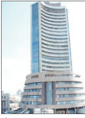
और 28 जून को जारी किये जाएंगे। इनका असर बाजार पर देखने को

मुंबई। भारतीय शेयर बाजारों के लिए पिछला सप्ताह कंसोलिडेशन वाला रहा। संसेक्स और निफ्टी दोनों में करीब 0.2 प्रतिशत की मामूली बढ़त रही। यह लगातार तीसरा सप्ताह था, जब बाजार में साप्ताहिक रिटर्न सकारात्मक रहा है। इस सप्ताह निवेशकों की नजर मानसून की प्रगति, जूलाई में आने वाले बजट, विदेशी निवेशकों द्वारा किये जाने वाले निवेश, कच्चे तेल की कीमत और वैश्विक बाजार पर रहेगी। वहीं, वैश्विक स्तर पर अमेरिका में पहली तिमाही का जीडीपी डाटा और व्यक्तिगत उपभोग व्यय मूल्य सूचकांक के आंकड़े 27