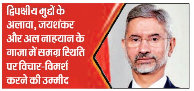
द्विपक्षीय मुद्दों के अलावा, जयशंकर और अल नाहयान के गाजा में समर्थित पर विचार-विमर्श करने की उम्मीद

विदेश मंत्रालय ने कहा कि विदेश मंत्री एस जयशंकर आज यूएई की आधिकारिक यात्रा पर जाएंगे। यात्रा के दौरान विदेश मंत्री संयुक्त अरब अमीरात के अपने समकक्ष के साथ साझेदारी के विभिन्न मुद्दों पर बैठक करेंगे। भारत और यूएई के बीच संबंध पिछले कुछ वर्षों में