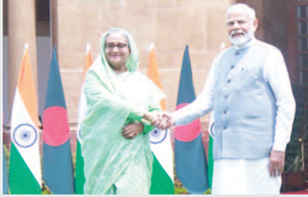
कि दोनों देशों ने नये क्षेत्रों में सहयोग के लिए भविष्योन्मुखी (फ्यूचरिस्टिक) विजन तैयार किया है। हरित साझेदारी, डिजिटल

हाउस में बांग्लादेश की प्रधानमंत्री शेख हसीना के साथ बातचीत के बाद कहा, बांग्लादेश भारत का सबसे बड़ा विकास साझेदार है। यह हमारी नेबरहुड फर्स्ट पॉलिसी, एकट ईस्ट पॉलिसी, विजन सागर और हिंद-प्रशांत विजन के संगम पर स्थित है। हमने मिलकर पिछले एक साल में अनेक महत्वपूर्ण जनकल्याणकारी परियोजनाएँ पूरी की हैं। दोनों देशों के विकास साझेदारी, ऊर्जा, जल संसाधन, व्यापार, रक्षा सहयोग आदि समेत द्विपक्षीय सहयोग के विभिन्न क्षेत्रों पर चर्चा की गई। पीएम मोदी ने कहा