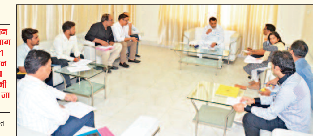
दिव्यांगजन शक्ति विभाग के तहत 11 लाख पेंशन और अन्य सुविधाएं भी प्रदान की जा रही हैं।