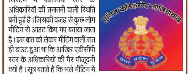
पुलिस कमिश्नर सिस्टम गाजियाबाद