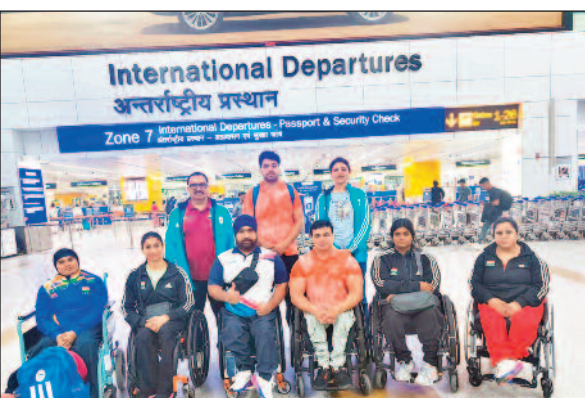
पैरालीपिक के लिए क्वालीफाई करने का एक आखिरी अवसर होगा। भारत की चार महिला खिलाड़ी इस प्रतियोगिता में ओलंपिक के लिए क्वालीफाई करने का प्रयास करेंगी।