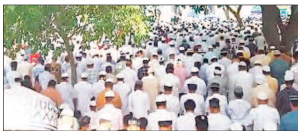
पुलिस की कड़ी चौकसी रही सोमवार को तहसील क्षेत्र में पुलिस की कड़ी सुरक्षा व्यवस्था के बीच नमाजियों ने मस्जिदों में नमाज पढ़ी। ईदगाहों व मस्जिदों के बाहर पुलिस मुस्तैद रही। क्षेत्र की अधिकतर मस्जिदों पर भारी पुलिस बल की मौजूदगी रही।