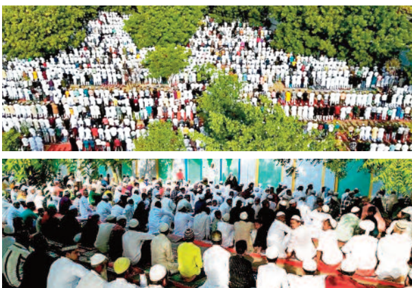
तरीके से ईद उल अजहा की नमाज संपन्न हुई। प्रशासनिक अधिकारी व पुलिस बल भी रहा मौजूद। नमाज के बाद लोगों ने पूरी दुनिया में शांति कायम रहे इसके लिए दुआ की और नमाज पढ़ने के बाद लोग अपने-अपने परिवार के लोगों के लिए मक़र्रस्तान पहुंचे और उनके लिए पक़र्रत की दुआ की। घर पहुंच कर लोगों ने

डासना, करंट क्राइम। ईद अल-अजहा के पावन पर्व को लेकर पूरे देश में हर्षोल्लास के साथ ईद का त्यौहार मनाया गया तो वहीं कुर्बानी का सिलसिला भी जारी रहा। सुबह उठकर लोगों ने नए कपड़े पहनकर सर पर टोपी और हाथ में मुसल्ला लिए ईदगाह की नमाज पढ़ने के लिए जाते नजर आए। डासना की एक पुरानी व बड़ी ईदगाह है जिसमें आसपास क्षेत्र के भारी संख्या में लोगों ने ईद की नमाज अदा की तो वहीं शिद्दत भरी गर्मी में लोगों ने ईदगाह में नमाज पढ़ने के लिए जाना नहीं छोड़ा और ईदगाह नमाजियों से पूरी भर गई। लोगों को ईदगाह में नमाज पढ़ने की जगह नहीं मिली तो ईदगाह से बाहर भी लोगों ने नमाज पढ़ी तो वहीं आसपास की क्षेत्र में दरगाह व मस्जिदों में लोगों ने नमाज अदा की और लोगों ने ईदगाह के लिए भारी संख्या में दान पुष्प भी किया। ईद की नमाज को लेकर प्रशासन की ओर से इंतजाम किये गए। शांतिपूर्ण