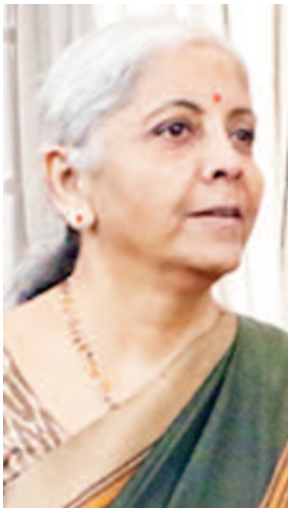
अनुमानित बजट वित्त वर्ष 2024-25 में 5.01 लाख करोड़ रुपये है, जो कि वित्त वर्ष 2023-24 में 4.76

नई दिल्ली। केंद्रीय वित्त मंत्री निर्मला सीतारमण इस हफ्ते इंडस्ट्री और किसानों के निकायों और राज्यों के वित्त मंत्रियों से प्री-बजट चर्चा करेंगी। बता दें, नई सरकार बनने के बाद वित्त वर्ष 2024-25 का पूर्ण बजट जुलाई के आखिरी में पेश किया जाना है। जानकारी के मुताबिक, वित्त मंत्री भारतीय कंपनियों के साथ गुरुवार को बैठक कर सकती हैं। इसके अलावा किसान एसोसिएशन और अर्थशास्त्रियों के साथ बैठक शुरुवार को हो सकती है। इसके अलावा सीतारमण की ओर से बजट पर राज्यों के लिए वित्त मंत्रियों के साथ बैठक शनिवार को नई दिल्ली में हो सकती है। राज्यों और केंद्रशासित प्रदेशों की सरकारों की मदद से केंद्र सरकार 108 केंद्रीय वित्तपोषित योजनाएं चला रही है। इनका अनुमानित बजट वित्त वर्ष 2024-25 में 5.01 लाख करोड़ रुपये है, जो कि वित्त वर्ष 2023-24 में 4.76