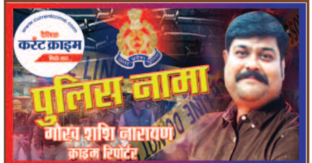
जब ऑन ड्यूटी थे एडीसीपी तो मीटिंग से वयो आउट