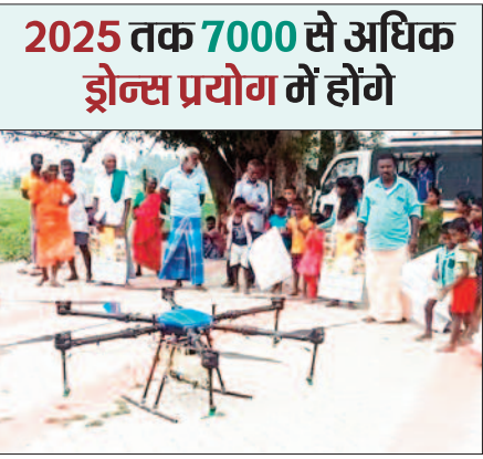
नई दिल्ली। कृषि क्षेत्र में पिछले कुछ सालों से ड्रोन की भूमिका लगातार बढ़ रही है। वर्तमान में कृषि क्षेत्र में 3,000