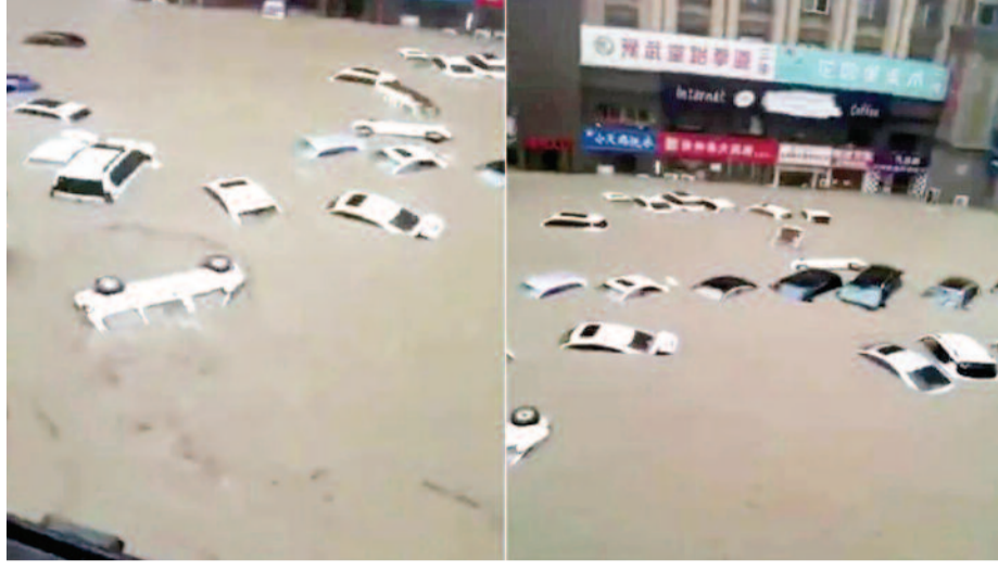
की संभावना है।

बीजिंग। यूएई और ओमान समेत कुछ खाड़ी देशों ने बीते हफ्ते भारी बारिश और बाढ़ का सामना किया है। दुनिया के अहम शहरों में से एक दुबई में एक दिन में ही एक साल के बराबर बारिश हुई, जिससे जीवन पूरी तरह से अस्त व्यस्त हो गया। यूएई के बाद चीन भी भारी बारिश और बाढ़ का सामना कर रहा है। दक्षिणी चीन में भूस्खलन के बाद और ज्यादा भीषण बाढ़ का अंदेशा है। चीन की ये बाढ़ कितनी भयावह है, इसका अंदाजा इस बात से लगाया जा सकता है कि मौसम के जानकारों इसे सदी में केवल एक बार आने वाली भीषण बाढ़ कह रहे हैं। 12 करोड़ से ज्यादा की आबादी इस मूसलाधार बारिश और बाढ़ से प्रभावित हैं। इस बारिश के बाद इलाके की प्रमुख नदियों का जलस्तर बढ़ गया है और इसके 19 फीट तक बढ़ने