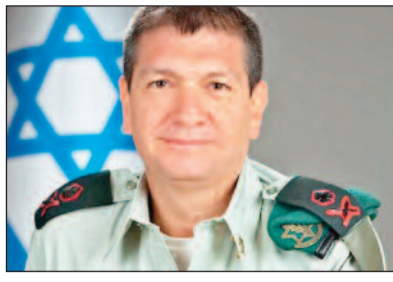
हमास के हमले की ली जिम्मेदारी

हमास का हमला न रोक पाने की ली जिम्मेदारी : हमास ने बीते