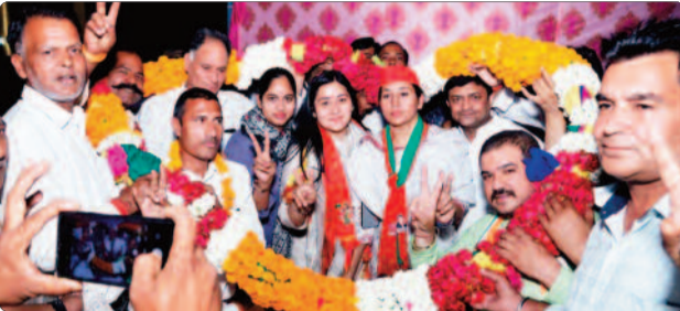
फिर ऐसी कोई समस्या नहीं होगी, जिसका समाधान संभव न हो सके। मैं खुद चौपाल लगाकर आपसे समस्या पूछूंगी और उसका समाधान निकालूंगी

आभार प्रकट किया। नूरनगर, सिहानी, गाजियाबाद में उन्होंने एक रोड शो आयोजित किया। इस दौरान लोग उनके साथ चलते रहे और कारवां बढ़ता चला गया। इस बीच उन्होंने हाथ जोड़कर लोगों का अभिवादन किया। वहीं, लोगों से भी उन्हें अपार स्नेह, समर्थन और आशीर्वाद मिला। उन्होंने सबका बहुत-बहुत धन्यवाद और आभार प्रकट किया। गांव रईसपुर, गाजियाबाद