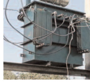
बिजली की मांग 1500 मेगावाट से ज्यादा पहुंच गई है।

नोएडा। इस गर्मी शहर में आठ हजार ट्रांसफार्मरों से बिजली व्यवस्था सुधरेगी। इसके लिए पश्चिमांचल विद्युत वितरण निगम ने करीब आठ हजार छोटे-बड़े ट्रांसफार्मरों का स्टॉक तैयार कर लिया है। इसके अलावा वर्कशॉप में मरम्मत कार्य भी तेज कर दिया गया है। ताकि लोगों को गर्मी में बिजली कटौती की समस्या से राहत मिल सके।