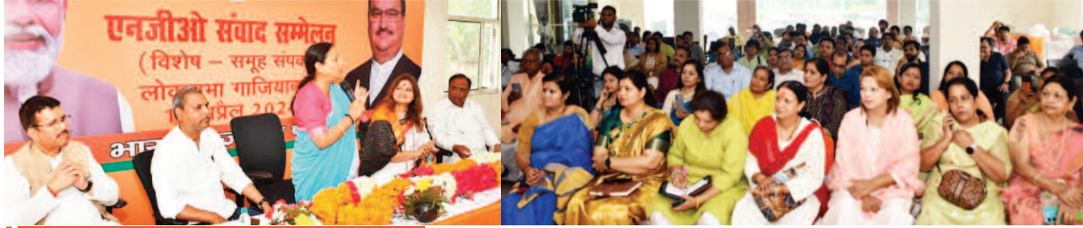
उत्तर प्रदेश के पोर्टल पर 11 हजार एनजीओ पंजीकृत होना महिला स्वावलंबन का जीता-जागता उदाहरण

गाजियाबाद, करंट क्राइम। राज्यसभा सांसद व भाजपा महिला मोर्चा की प्रदेशाध्यक्ष गीता शाक्य ने कहा कि प्रदेश में महिलाओं द्वारा संचालित स्वयं सहायता समूहों ने महिला सशक्तिकरण के नये आयाम स्थापित किये हैं। उत्तर प्रदेश के पोर्टल पर 11 एनजीओ पंजीकृत हैं, जिनमें अधिकांश पिछले कुछ सालों से महिलाओं द्वारा चलाये जा रहे स्वयं सहायता समूह शामिल हैं। करीब 2500 हजार एनजीओ महिलाएँ चला रही हैं और इनके उत्पादों की भारी मांग है। सांसद गीता शाक्य रविवार को